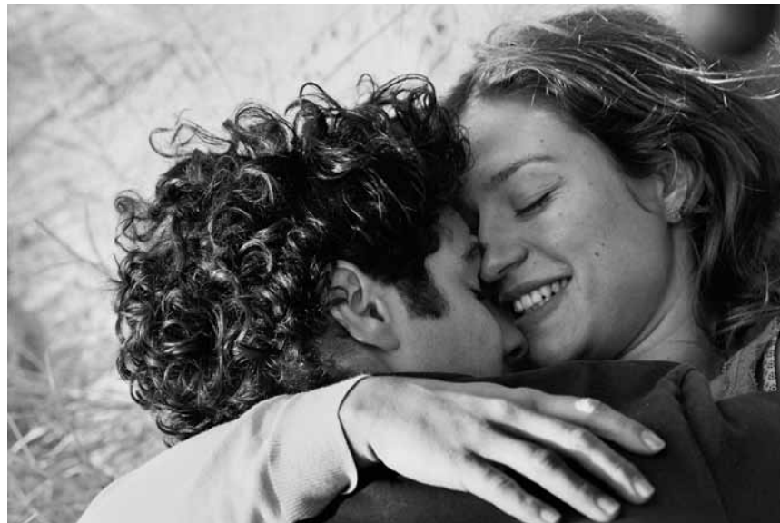
« A perdre raison » raconte les méandres de la folie créés par une dépendance émotionnelle, nouveau à l'Utopia.

Tal est une jeune Française installée à Jérusalem avec sa famille. Après l'explosion d'un kamikaze dans un café de son quartier, elle écrit une lettre à un Palestinien imaginaire où elle exprime ses interrogations