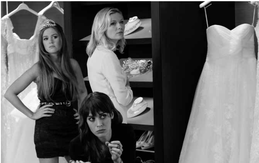
Heiratswillige Singlefrauen in einer belanglosen Romantic-Comedy, die wieder mal gut ausgeht: „Bachelorette“, im Utopolis.