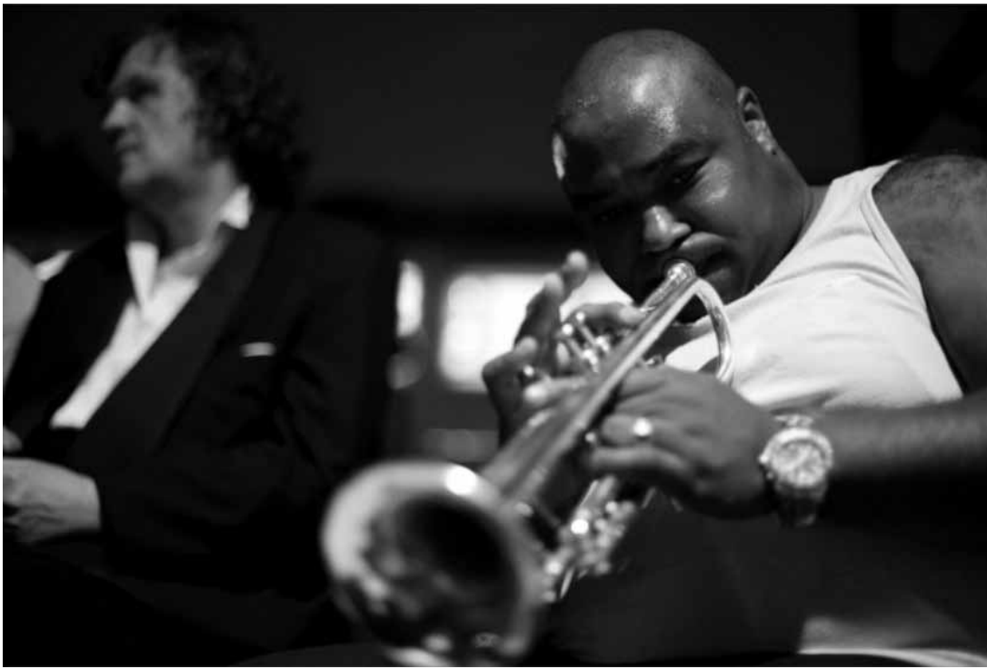
Mélancolie et romantisme à la Havane.