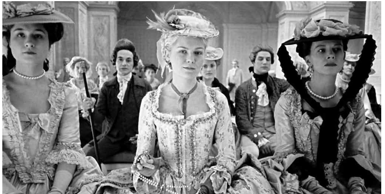
Là elle a encore toute sa tête: « Marie-Antoinette » de Sofia Coppola, jeudi à la Cinémathèque.

Es schneit einfach nicht mehr in dem ehemals florierenden, kleinen Skiort in den Bergen - und das schon seit fünf Jahren! Klimawandel sagen die einen, unterlassene Hilfeleistung Gottes die anderen. Die Touristen bleiben aus, der wirtschaftliche Kollaps sorgt für eine anhaltende Flaute - und zwar in jeder Hinsicht. Auch Wirt Georg und seine Frau Emilie hatten definitiv schon bessere Zeiten, sowohl finanziell, als auch in ihrem Liebesleben. Als seine anstrengende und religionsfanatische Schwiegermutter Daisy überraschend das Zeitliche segnet, hat Georg die kühne wie rettende Idee: Daisy muss heiliggesprochen werden!