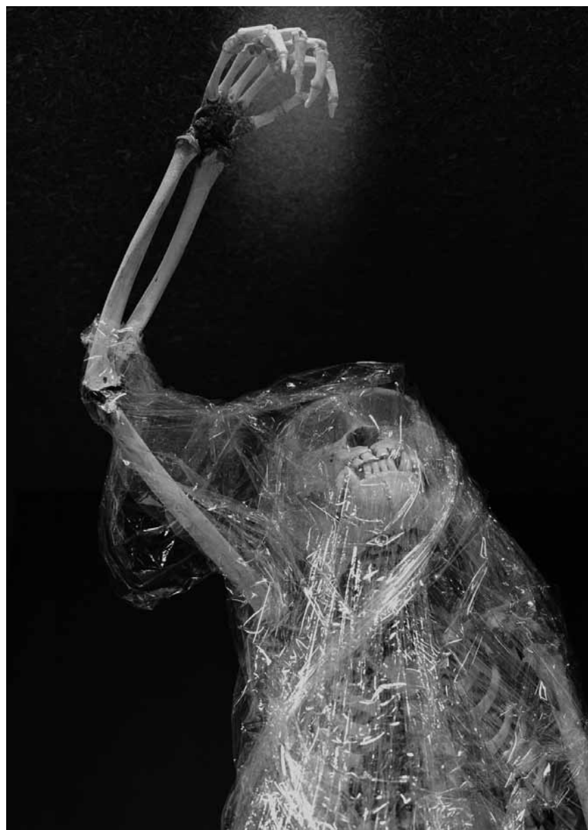
Macabres à volonté: « Mémoires » les photographies de Chantal Vey sont à la montée de l'église à Clervaux, encore jusqu'à ce vendredi 14 septembre.