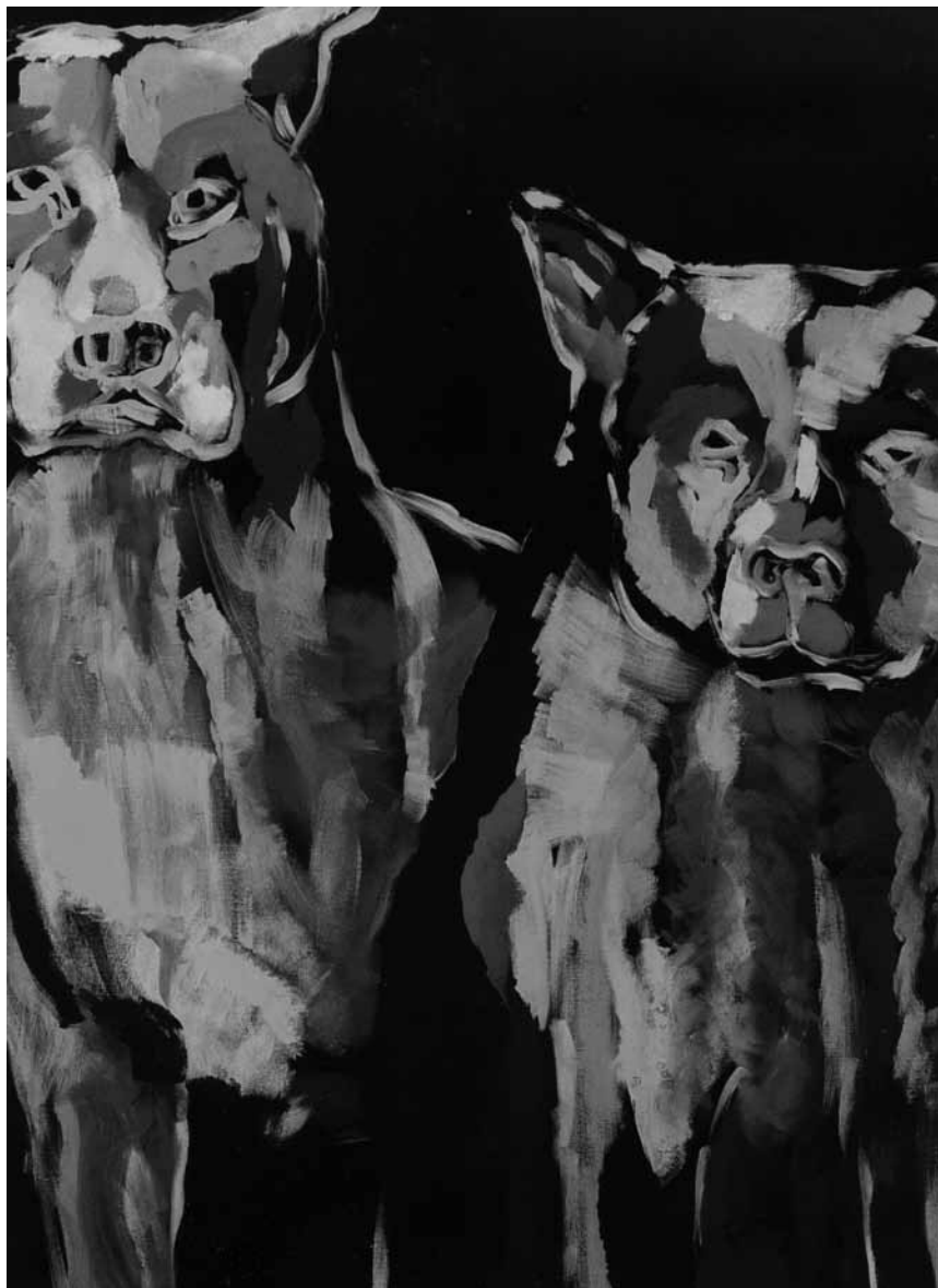
« Humenaf » - les dessins et peintures de Nadine Cloos sont à voir au Fond-de-Gras, encore jusqu'au 23 septembre.