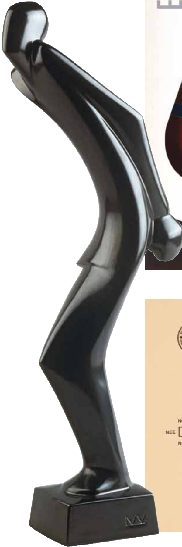
Prisonnier politique, faïence V&B d'après une sculpture de Lucien Wercollier

Avec son projet CARTE BLANCHE, l'hebdomadaire woxx met ses pages centrales à disposition des instituts culturels luxembourgeois. Pendant six éditions, ils peuvent disposer librement de cet espace pour offrir un aperçu de leurs collections.