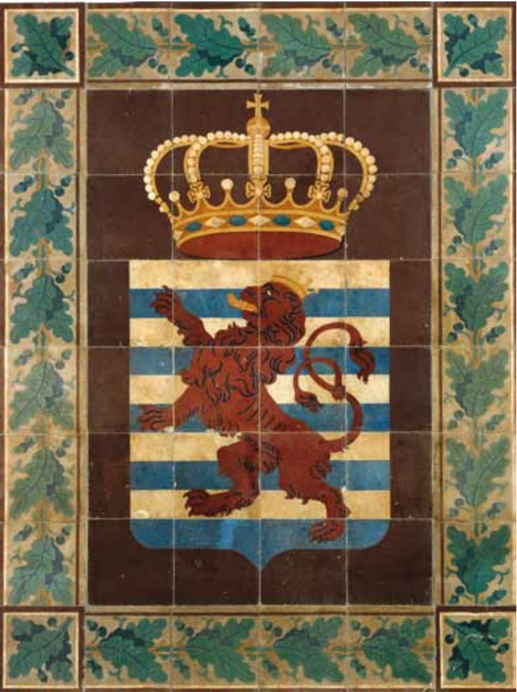
Carrelage avec les armoiries du pays provenant de la Chambre des députés, vers 1854