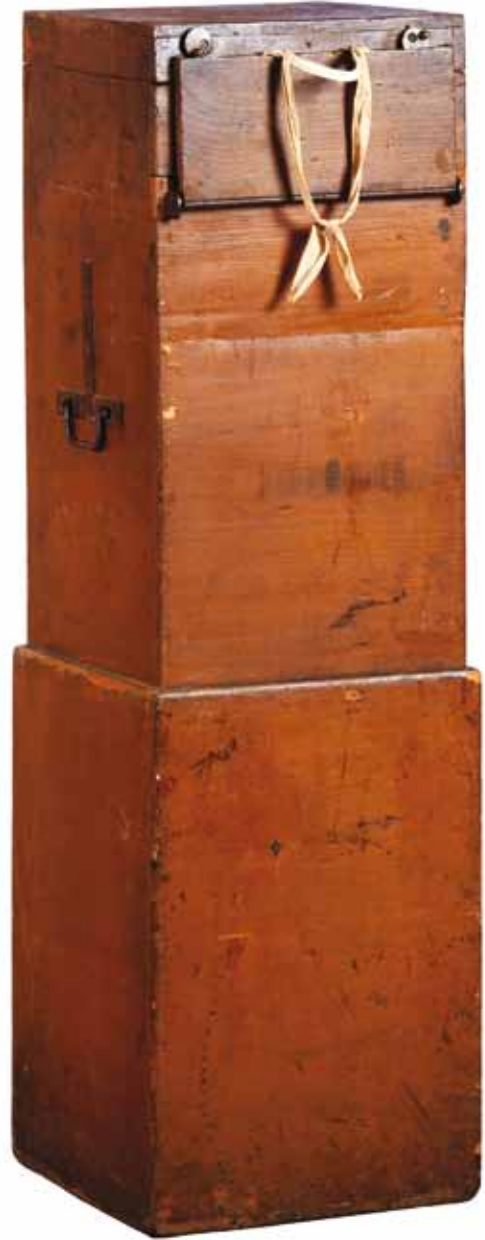
Urne électorale, vers 1930