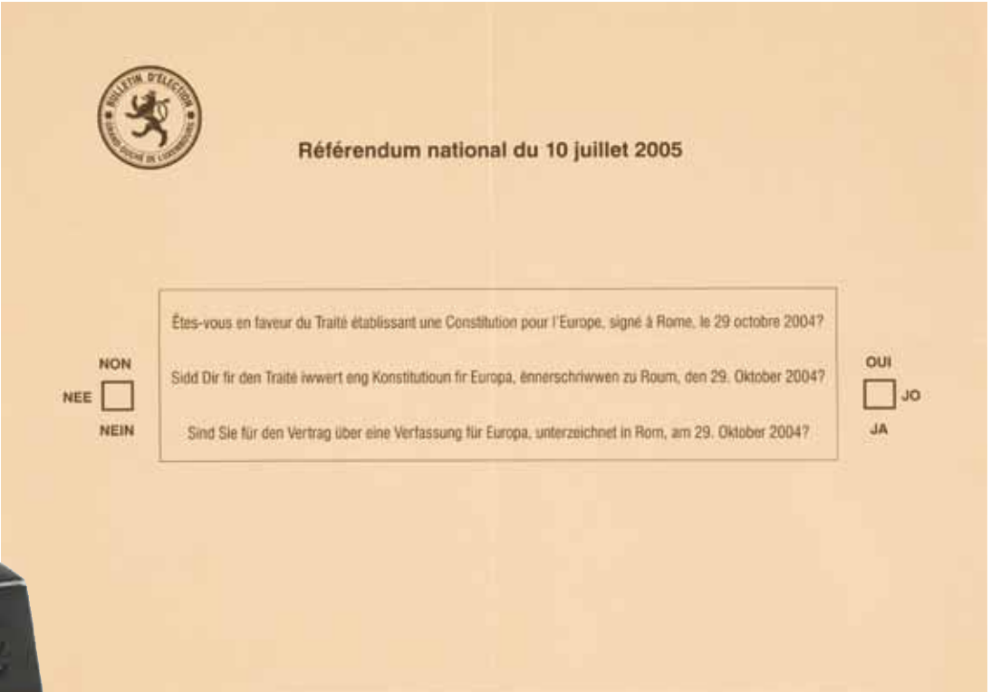
Bulletin de vote utilisé lors du référendum sur la constitution européenne, 2005