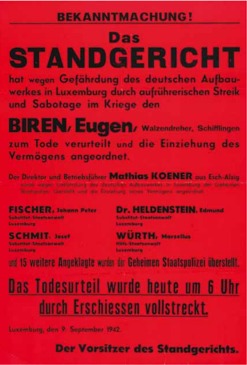
Affiche annonçant l'exécution des grévistes qui ont protesté contre l'introduction du service militaire obligatoire sous l'occupation allemande, 1942