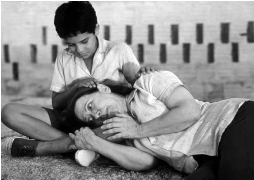
Walter Salles Meisterwerk „Central do Brasil“, läuft am Freitag im Rahmen des Brazil Film Festival in der Cinémathèque.