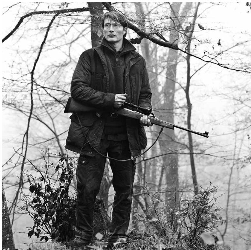
Regisseur Thomas Vinterberg ist wieder einmal bei seinem Lieblingsthema gelandet: kriminelle Familiengeheimnisse - „Jagten“, neu im Utopia.