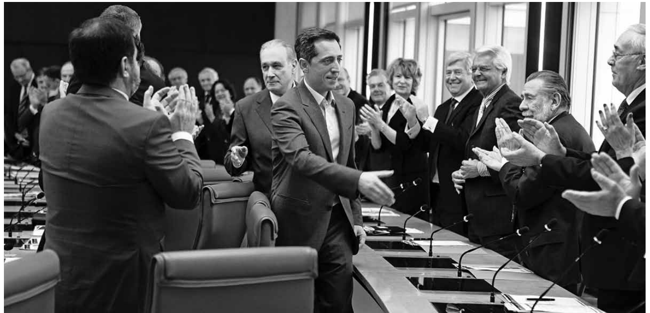
Gad Elmaleh incarne un jeune banquier sans scrupules qui monte vite sur l'échelle du pouvoir... pour en retomber assez brutalement : « Le capital », nouveau à l'Utopia.

Schriftsteller Ellison zieht mit seiner Familie in ein Haus in dem vor Jahren eine Familie auf ungeklärte Weise ums Leben kam. Ellison glaubt nicht an die Gerüchte, doch findet er auf dem Dachboden verstörende Familienaufnahmen. Während er mit der Lösung des Rätsels beschäftigt ist,