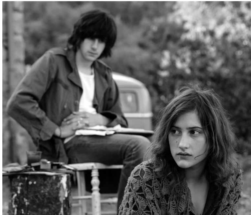
Amour, art ou révolution? Le jeune Gilles ne sait pas où le destin va le mener, dans le nouveau film d'Olivier Assayas: « Après mai », nouveau à l'Utopia.

XXXX La mise en scène se passe d'expérimentations en tout genre et garde les codes classiques du bon polar à l'européenne. (lc)