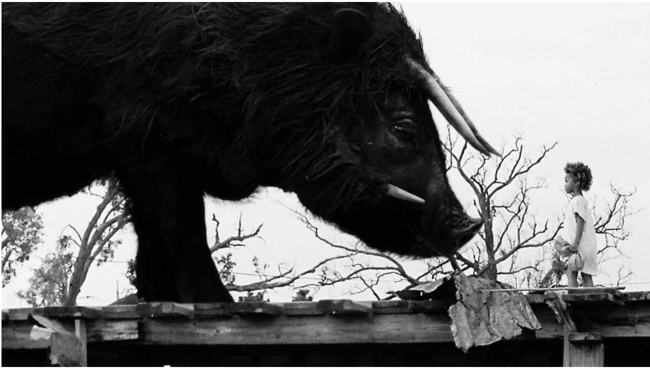
Hushpuppy et l'auroch : une scène qui restera dans la mémoire cinématographique.