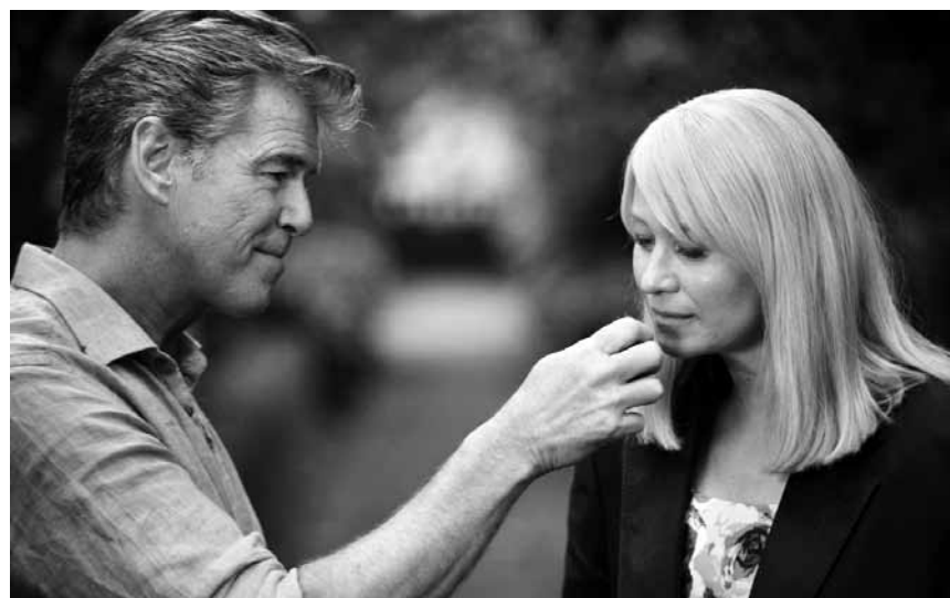
Eine gute Wahl, dachten sich die Verliebten - doch die Hochzeit wird Klarheit schaffen. „Love is All You Need“, neu im Utopia.