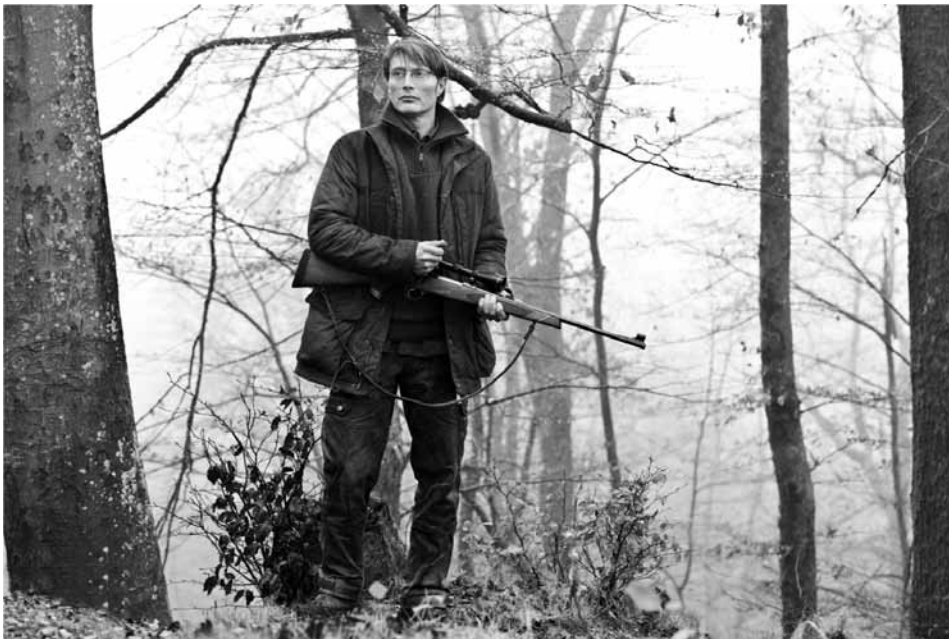
Von der Jagd auf Tiere zu der Jagd auf Menschen. Mads Mikkelsen in „Jagten“