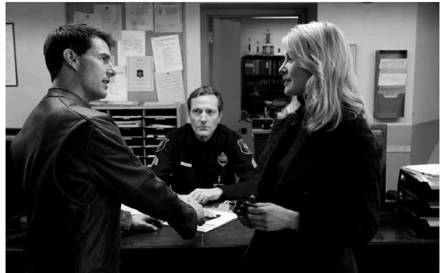
Tom Cruise ist mal wieder im Einsatz doch diesmal nicht für Scientology. „Jack Reacher“, neu im Ciné Belval und Utopolis.

Um eine romantische Hochzeit zu feiern, treffen zwei ganz und gar unterschiedliche Familien aufeinander.