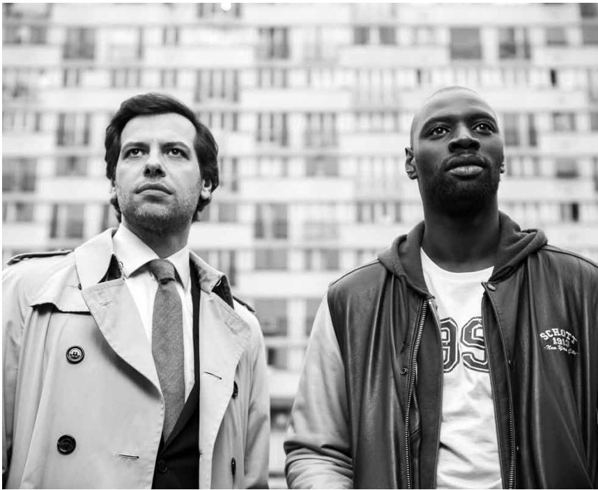
La cité, un corps retrouvé mort, un climat social extrême. Ce sont les ingrédients du film „De l'autre côté du périph“. Nouveau à l'Utopolis.