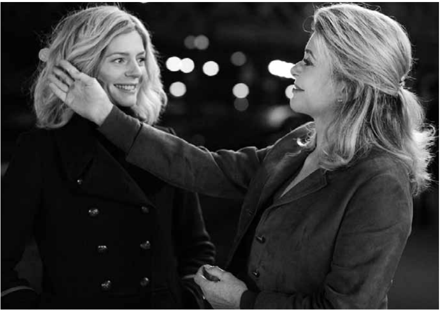
L'amour et le temps qui passe, sont au centre de « Les biens-aimés », avec Chiara Mastroianni et Catherine Deneuve, nouveau à l'Utopia.

Alex beginnt, nachdem seine Freundin Carolin ihn verlassen hat, eine Reise zu sich selbst. Seine neue, etwas chaotische Freundin Nele, ist in Sachen Beziehungen selbst noch nicht wirklich sortiert. Sein bester Freund Okke, ein testosterongeladener, liebenswerter Macho, gibt ihm Unterricht