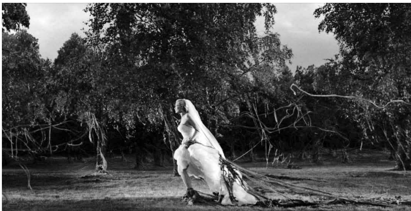
LARS VON TRIER