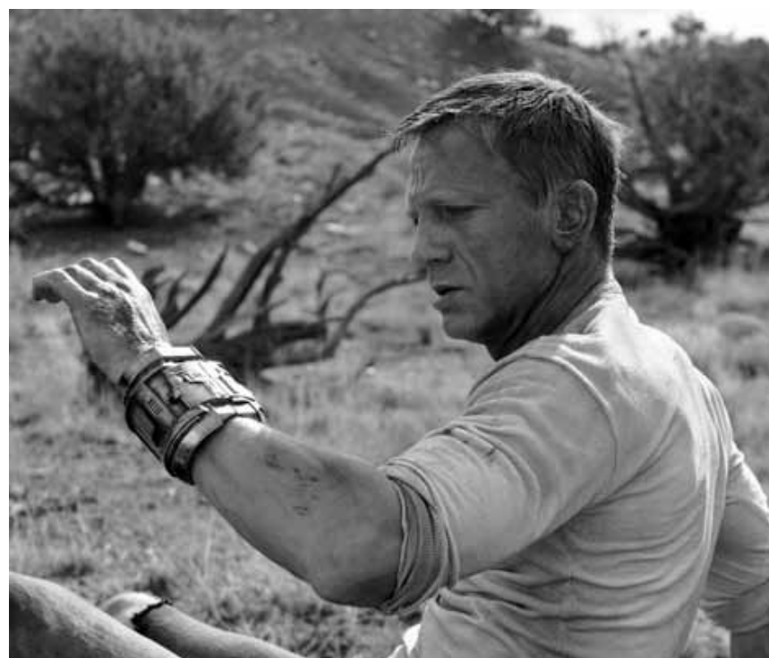
Hat gerade einen kleinen Anachronismus erlebt : Daniel Craig in „Cowboys & Aliens“. Neu im Utopolis, CinéBelval und Starlight.

Trotz ihrer Heirat werden Justines Depressionen stärker und sie zieht zu ihrer Schwester Claire auf deren