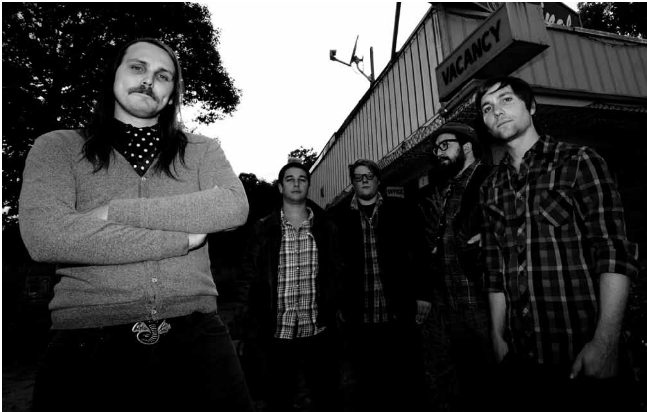
Des Canadiens au son californien: The Snips.