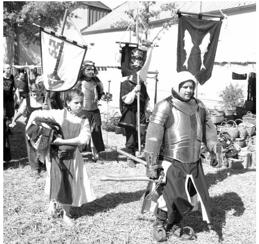
Offenbar wollen nicht nur die Royals und die Regierung zurück ins Mittelalter, sondern auch die Dödelinger: Das Butscheburger „Buergfest“ findet an diesem Samstag und Sonntag statt.