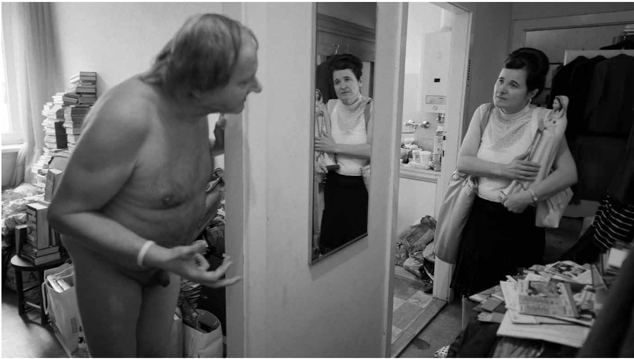
Die Muttergottes liebt auch die Nackten ...