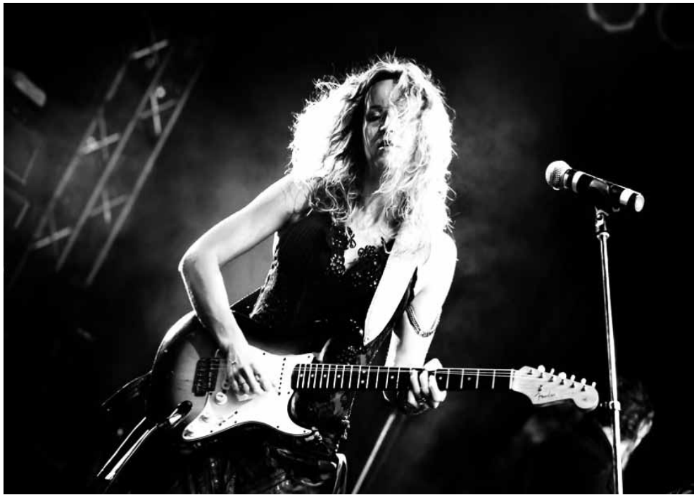
Die serbische Blues-Gitarristin und Sängerin Ana Popovic ist ein rockiges Energiebündel und gerngesehener Gast auf hiesigen Bühnen.