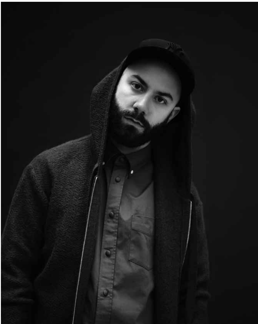
Woodkid ist keine Marionette, sondern das aufsteigende Talent am Elektro-Horizont und spielt am 13. Juli in der Abtei Neumünster.