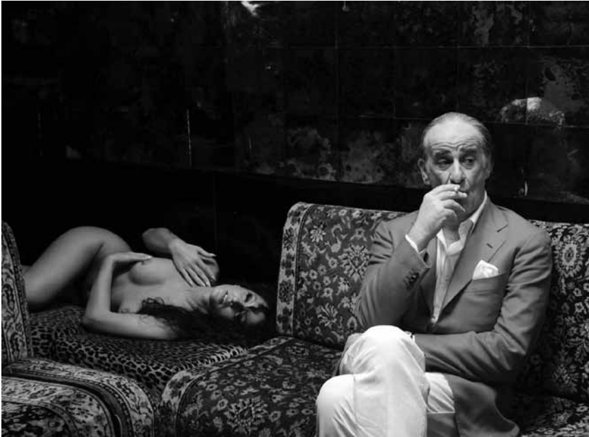
Dans « La grande bellezza », la frustration littéraire se frotte à la beauté de la Cité éternelle... Nouveau à l'Utopia.

Leben. Als es zu einigen mysteriösen Vorfällen kommt, die auf das Konto eines neuen Superschurken gehen könnten, sieht sich Gru vor neue Aufgaben gestellt - ob er will, oder nicht.