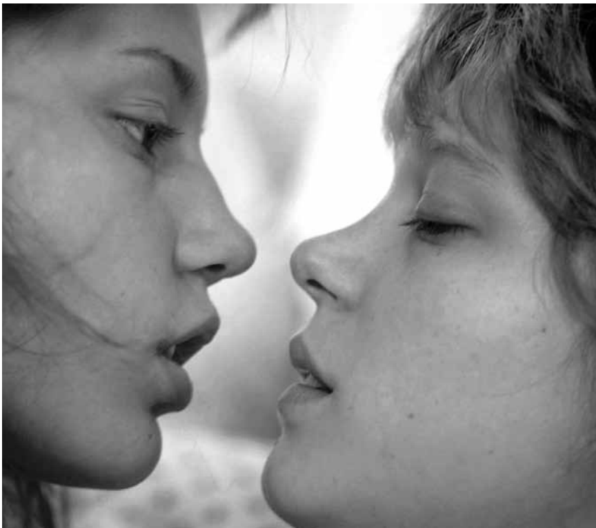
« La vie d'Adèle », risque de devenir la victime des polémiques qui ont accompagné le tournage - pourtant les récompenses cannoises ne peuvent pas tromper. Nouveau à l'Utopia.

Le Luxembourg sidérurgique Projection de quatre courts métrages documentaires. Kinosch, lu. 18h. Vu Feier an Eisen , L 1997 vum Gustave Labruyère , 72', o. V. lëtz. Stol , L 1998 vum Claude Lahr , 76', o. V. lëtz. De leschte Héichuewen , L 1997 vum Menn Bodson a Romain Goerend , 18', o. V. lëtz. Esch-sur-Alzette - métropole du fer , L 1956 d'Alyose Crelot et Nicolas Laux , 20', v. o. fr.