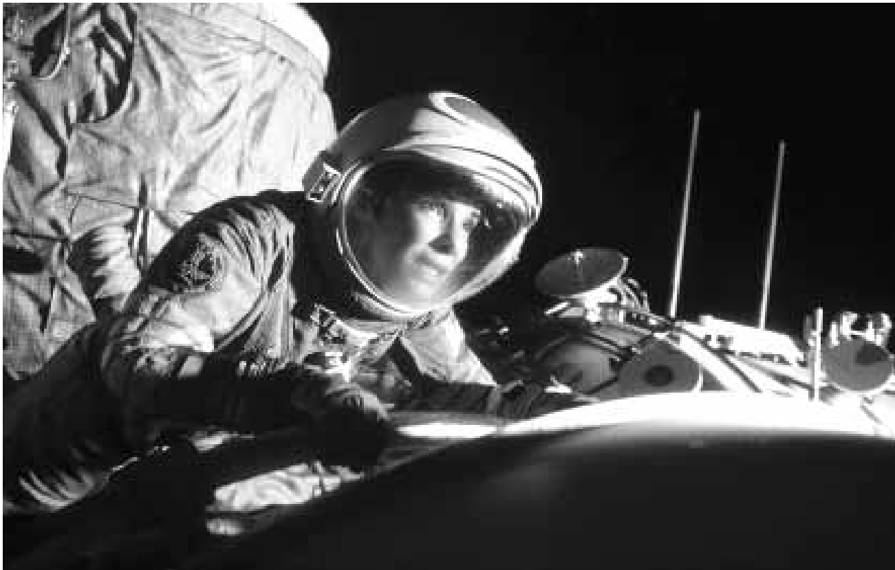
Schwereelos in die Katastrophe: „Gravity“ ist mehr als Science-Fiction.