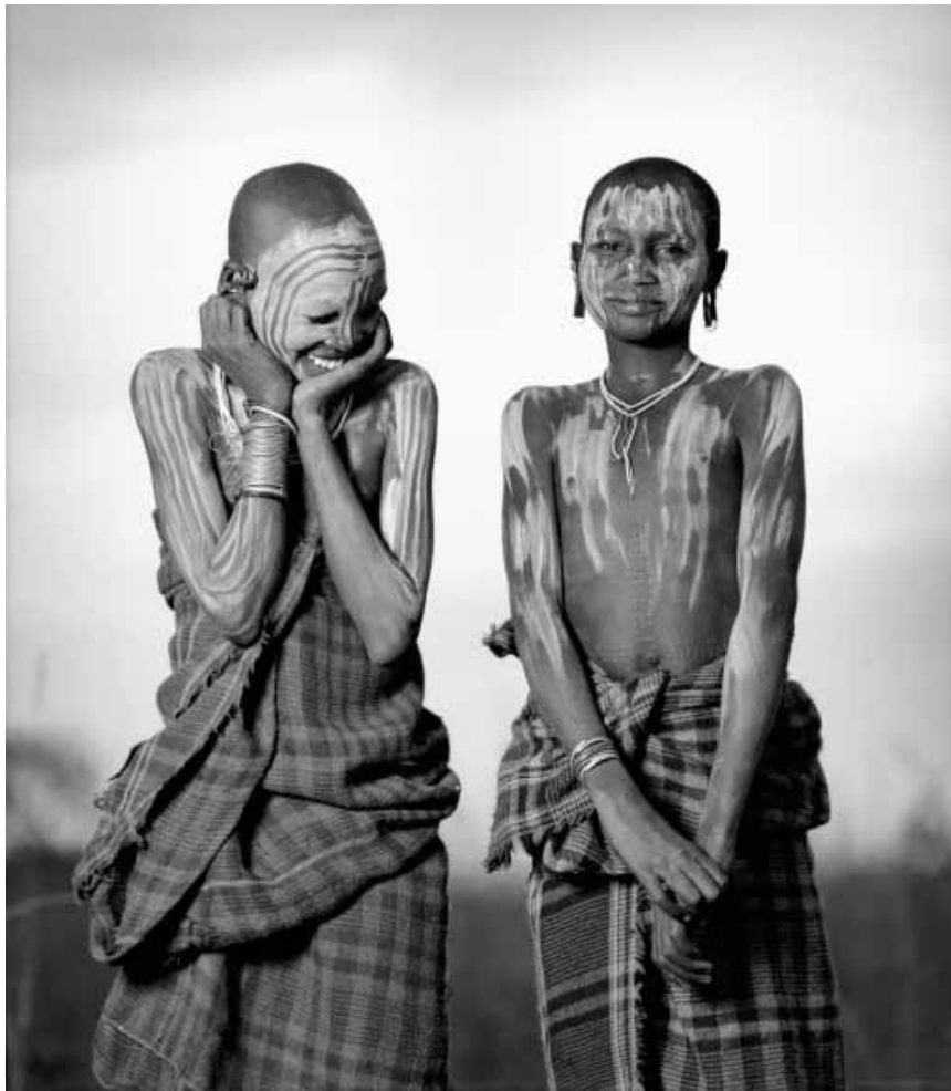
Les « Masterpieces » d'Isabelle Munoz seront encore visibles à la galerie Clairefontaine Espace 1, exposition prolongée jusqu'au 9 novembre.