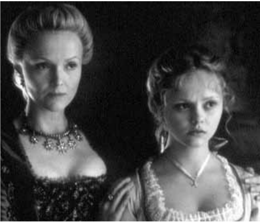
Le classique de la littérature anglaise « Sleepy Hollow » de Tim Burton est porté à l'écran dans le cadre du cycle de l'Université populaire du Cinéma à la Cinémathèque, ce lundi.

Les déboires amoureux de Leo, reine du roman à l'eau de rose et qui de plus n'arrive pas à remplir le contrat passé avec son éditeur.