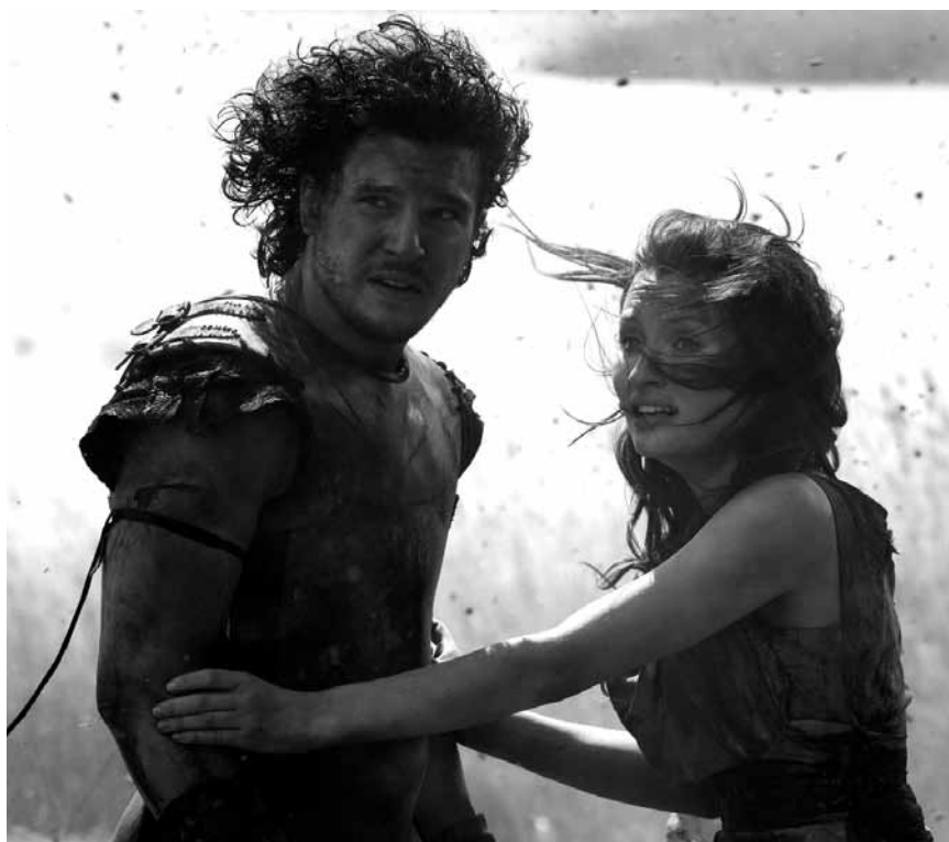
„Pompeii“ von Paul W.S. Anderson ist eine freie fiktive Interpretation der größten Naturkatastrophe aller Zeiten. Neu im Utopolis.