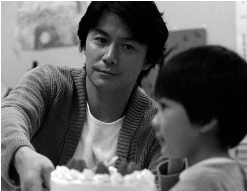
Hirokazu Koreedas Film „Like Father, Like Son“ stellt ganz poetisch Vaterschaft und Blutsverwandschaft in Frage. Der Gewinner des Preises der Jury in Cannes 2013 wird am Samstag und Sonntag, im Rahmen von „Asian’s Masterpieces“, im Utopia gezeigt.