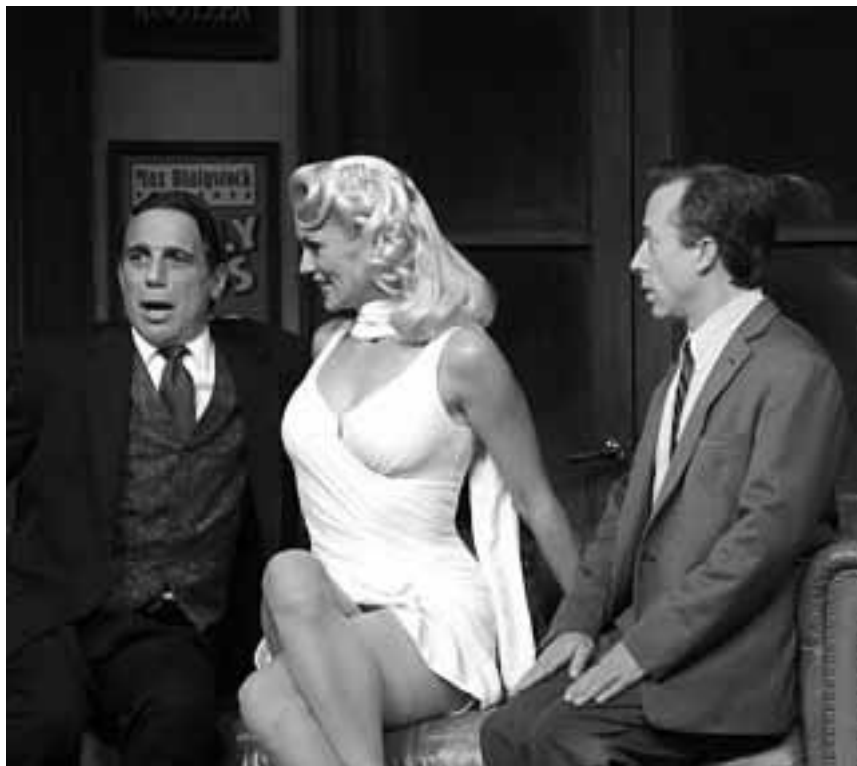
Le Kinosch propose de revoir ce vendredi la comédie de Mel Brooks „The Producers“, dont l'humour n'a pas pris une ride.

Ila lebt in der indischen Metropole Mumbai. Seit geraumer Zeit wird sie von ihrem Mann vernachlässigt und genau das beabsichtigt sie mittels ihrer würzigen Kochkunst zu ändern. Sie zaubert ihrem Gatten köstliche Mahlzeiten, die sie ihm durch sogenannte Dabbawallas zukommen lassen will. Diese Lieferanten haben sich darauf spezialisiert, Büroangestellten das frisch zu Hause zubereitete Mittagessen direkt an den Arbeitsplatz zu bringen. Doch bei der Lieferung an Ila's Mann geht etwas schief, die Essensbox landet trotz überaus penibler Kennzeichnung nicht dort, wo sie hin soll