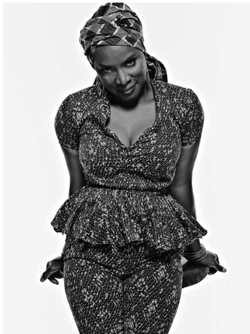
La chanteuse, musicienne, chorégraphe et compositrice béninoise Angélique Kidjo étalera tous ses talents le 29 avril à l'Atelier.

Bal tchéco-luxembourgeois , Centre culturel Kinneksbond, Mamer, 19h30. Tél. 26 39 51 60 (ma. - ve. 13h - 17h).