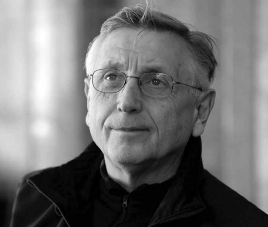
Jirí Menzel sera présent ce vendredi à la Cinémathèque. Projection de son film « Skrivánci na iti ». Contre le stalinisme, un petit vent de liberté a soufflé en Tchécoslovaquie.