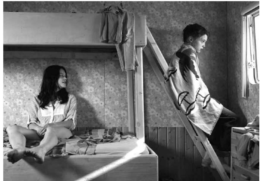
Dans « Puppy Love », les drames de l'enfance et de l'adolescence se croisent. Nouveau à l'Utopia.

Lorsque le médecin Colin apprend par mégarde à sa femme Kathryn que les jours de son patient George Riley sont sans doute comptés, il ignore que celui-ci a été le premier amour de