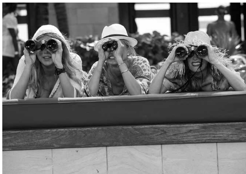
Drei verletzte Frauen wollen einem Macho den Garaus machen: „The Other Woman“, neu im Le Paris, Orion, Prabbeli, Starlight, Sura, Utopolis Belval und Kirchberg.

Kelly und Mac Radner sind ein leicht spießiges Ehepaar, das mit seinem Baby in einer beschaulichen Vorstadtsiedlung wohnt. Die Radners lieben die Ruhe in ihrer netten Nachbarschaft und begrüßen Neuankömmlinge mit offenen Armen. Doch als in das Haus nebenan eine feierwütige Studentenverbindung einzieht, ist es vorbei mit dem Frieden.