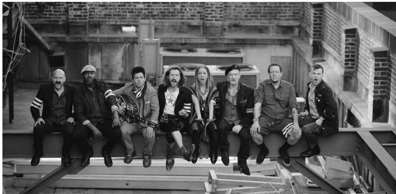
Nomen est omen : Gogol Bordello viendront foutre le bordel à l'Atelier, le 21 août.

Heute ist nichts los, da bleibt wohl nur die woxx nochmal zu lesen ..., bei gutem Wetter vielleicht im Garten, oder auf Balkonien, 10h.