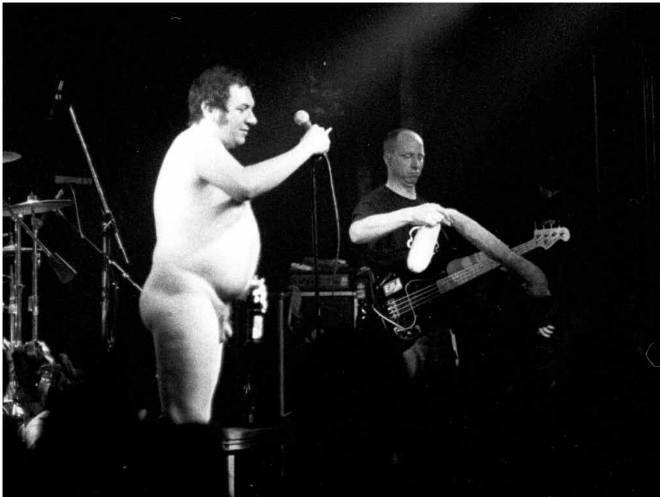
Auch mal eher leger gekleidet: „Die Kassierer“.

Mitten im Sommerloch lädt das Trierer Ex-Haus zum Pogen ein - und zwar mit „Die Kassierer“, der wahrscheinlich letzten real existierenden Punk-Band Deutschlands.