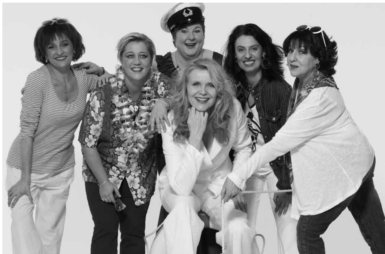
Im hohen Norden geht die Post ab! Am 20., 21. und 22. Februar beglücken die „Wilden Weiber“ das Cube 521 mit ihrer Comedy- und Musikperformance.