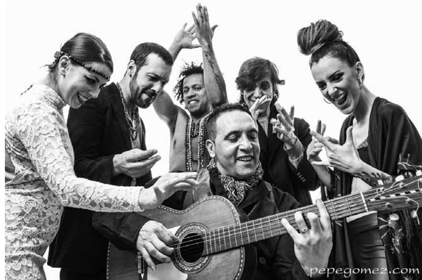
Salsa con sabor ! L'ensemble catalan Lenacay rencontre ce samedi 14 mars les Triviens d'El Cartel de la Salsa, dans le cadre du Festival des migrations.