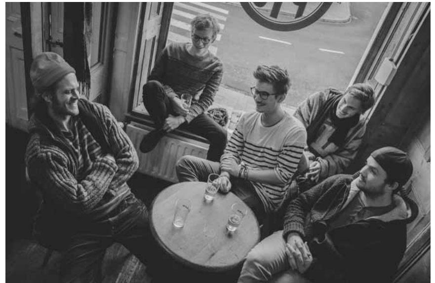
Les cinq musiciens de Seed to Tree font un retour éclatant avec leur nouvel album « Wandering », ce samedi 14 mars à la Rockhal.