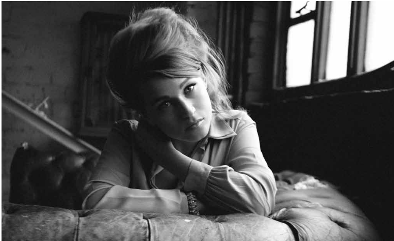
30.4. Selah Sue Selah Sue heizt am 30. April in der Rockhal Box mit Reggae-Ragga-Soul ein

Les palplanches - produit de marque de Belval , par Roland Bastian, bâtiment « Massenoire » (avenue du Rock'n'Roll), Belval , 19h30.