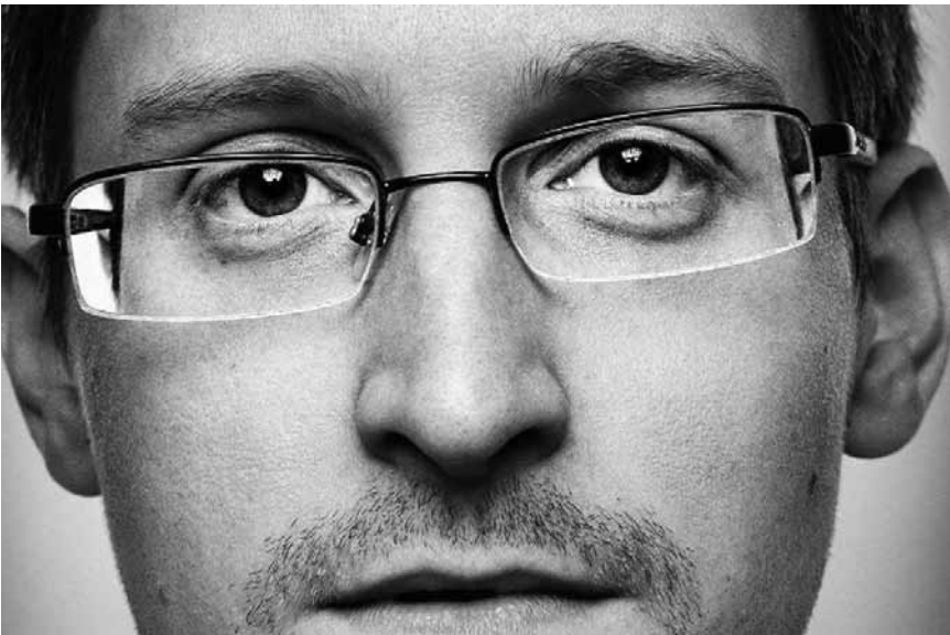
Filmisches Aufklärungswerk? Die Oscar-prämierte Doku „Citizenfour“ über den US-amerikanischen Whistleblower Edward Snowden läuft ab nächster Woche im Utopia.

operetta by Franz Lehár. Cast: Renée Fleming, Nathan Gunn and Kelli O'Hara. 165' with one intermission. Met Summer Encores, from the Metropolitan Opera, New York.