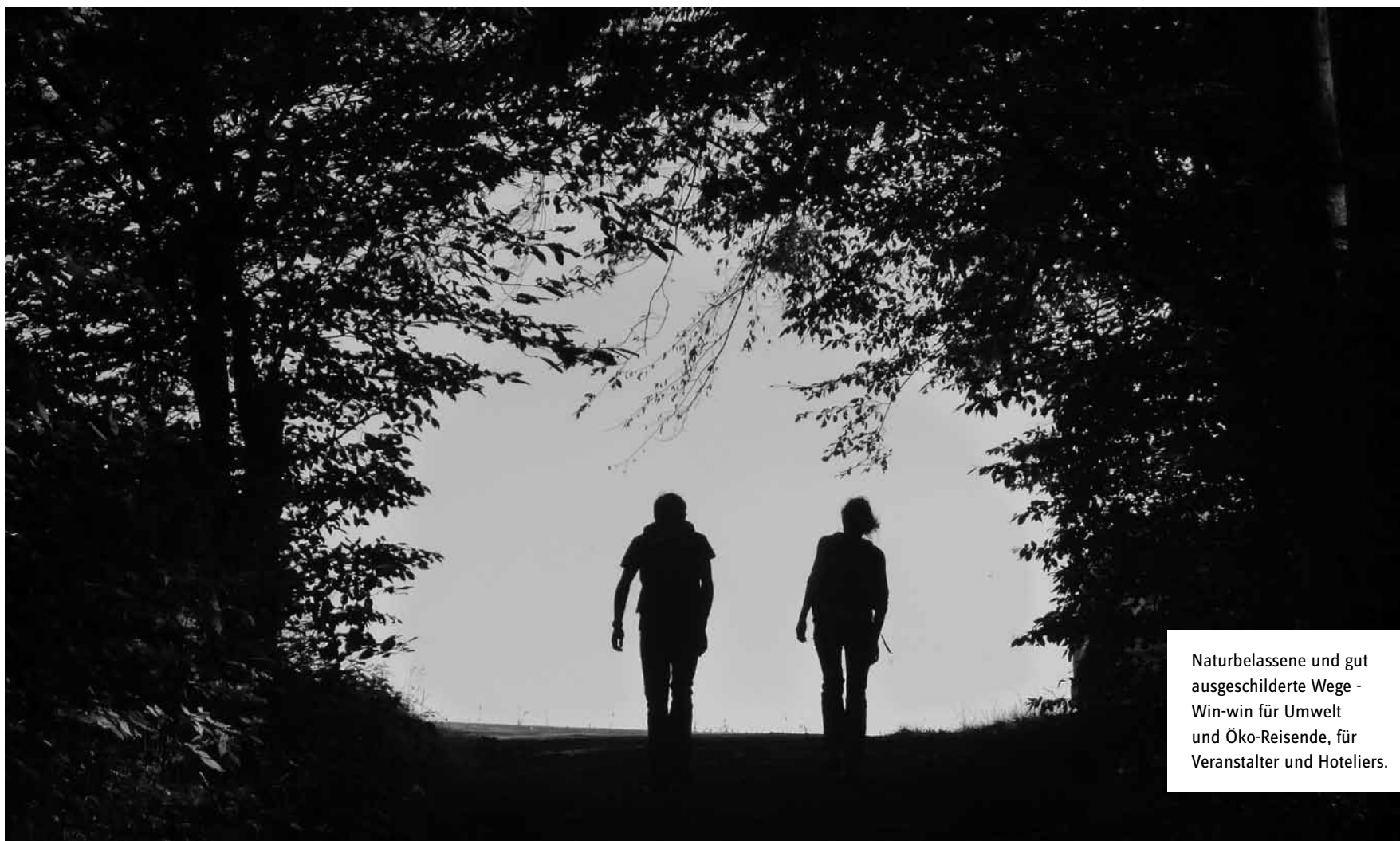
Naturbelassene und gut ausgeschilderte Wege - Win-win für Umwelt und Öko-Reisende, für Veranstalter und Hoteliers.