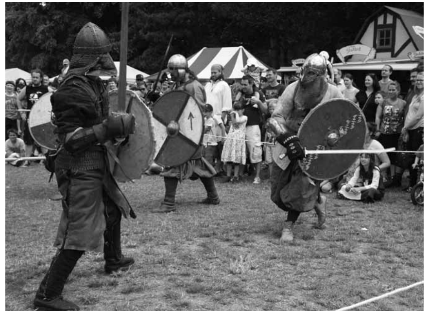
Wer sich mit Schwert und Ritterrüstung abreagieren will, kann das dieses Wochenende in Trier tun. Vom 7. bis zum 9. August finden im Palastgarten die „Mittelaltertage“ statt.