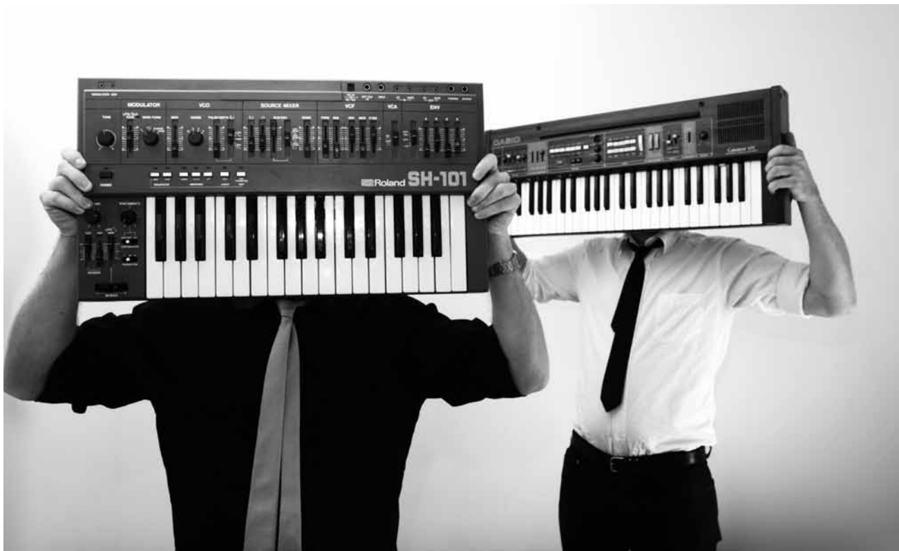
Ils aiment bien se voiler la face... synthétiquement : AK/DK.