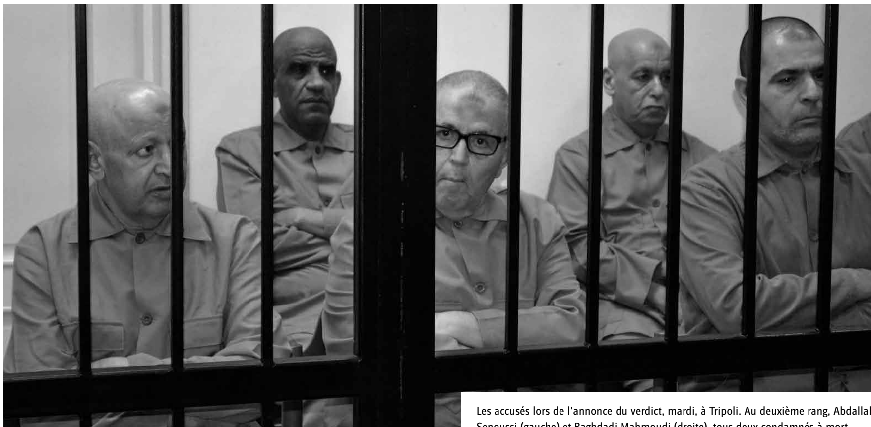
Les accusés lors de l'annonce du verdict, mardi, à Tripoli. Au deuxième rang, Abdallah Senoussi (gauche) et Baghdadi Mahmoudi (droite), tous deux condamnés à mort.

au sud-ouest de Tripoli, l'héritier désigné du dictateur est utilisé comme un trésor de guerre depuis sa capture en novembre 2011. Il a en effet permis à Zintan, petite ville bédouine de quelque 25.000 habitants, d'acquiescer une image de fief révolutionnaire important. Saïf al-Islam n'a ainsi jamais été remis aux autorités libyennes - et encore moins à la Cour pénale internationale qui le réclame depuis 2011. Au début de son procès, l'héritier de Mouammar Kadhafi assistait aux audiences par écran interposé. Mais les combats qui ont débuté dans l'Ouest libyen en juillet 2014 ont vu s'opposer les troupes de Fajr Libya, qui contrôlent aujourd'hui Tripoli, aux Zintanis. Résultat : Saïf al-Islam n'a pas été vu en public et n'a pas participé à son procès depuis plus d'un an. Sadiq al-Sour, le procureur, a affirmé qu'il serait réentendu le jour où il tomberait aux mains des autorités libyennes.