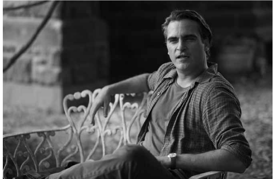
Par contre ici, il se sent mieux.