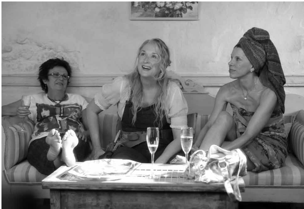
In dem überdrehten Hochzeitsfilm „Mamma Mia“ dreht sich alles um die Suche nach dem unbekannten Vater. Die US-amerikanische Musikkomödie ist unterlegt mit Sounds von ABBA. An diesem Samstag in der Schlittschuhbahn Galgenberg.

USA 2015 von Colin Trevorrow. Mit Chris Pratt, Bryce Dallas Howard und Nick Robinson. 124'. Ab 12.