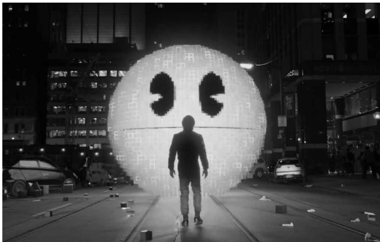
Dans « Pixels », inspiré d'une courte vidéo qui a fait le buzz sur l'internet en 2010, les envahisseurs sont des personnages de jeux vidéo. Aux Utopolis Belval et Kirchberg.

Die Minions gibt es schon seit Anbeginn der Zeit und die kleinen, gelben Helferlein sehen den einzigen Zweck ihrer Existenz darin, einem Bösewicht zu dienen. Doch immer wieder sterben ihnen die Meister vor