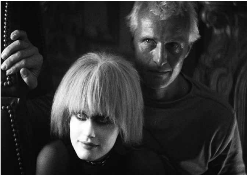
Les « Summer Follies » au cinéma Utopia permettront encore cette semaine et celle d'après de revoir ce chef-d'œuvre du cinéma de science-fiction qu'est « Blade Runner ».

Jurassic World USA 2015 von Colin Trevorrow. Mit Chris Pratt, Bryce Dallas Howard und Nick Robinson. 124'. Dt. Fass. Ab 12.