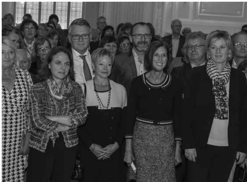
Die Zeiten des Gleichstellungskampfes sind wohl vorüber. Festakt zu 40 Jahren Nationaler Frauenrat.

CNFL die Gemeinden dazu bewegen, verstärkt Frauen bei der Wahl von Straßennamen in neuen Vierteln zu berücksichtigen. Ein Vorhaben, das mit gutem Willen, Sensibilität und einem entsprechenden Bildungs-Background funktionieren kann, wie der Schöffenrat in Düdelingen bewies.