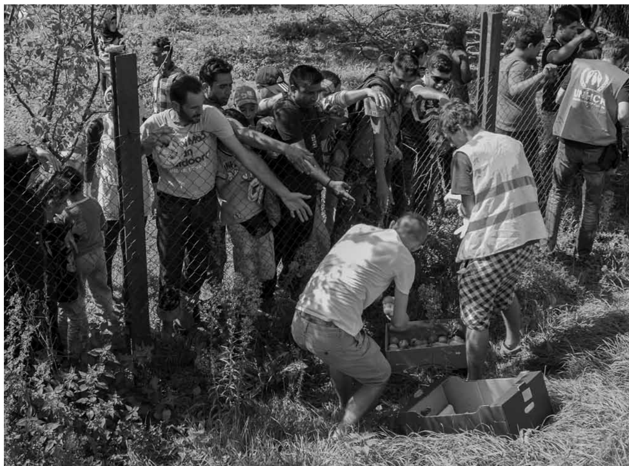
Auf freiwillige Helfer angewiesen: Auch im serbischen-kroatischen Grenzgebiet, wie hier bei Tovarnik, wurde in den vergangenen Wochen von öffentlicher Seite zum Teil selbst minimale Versorgung mit Wasser und Lebensmitteln nicht bzw. nicht ausreichend gestellt.