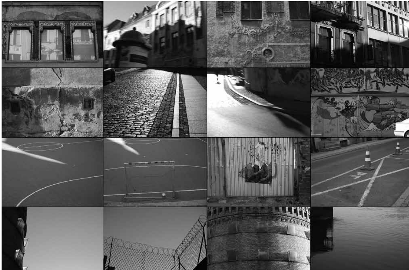
Dans le cadre du CinÉast, Neimënster montre « Histoires urbaines » - une exposition regroupant sept photographes questionnant la ville comme phénomène social et architectural - du 8 octobre au 25 octobre.