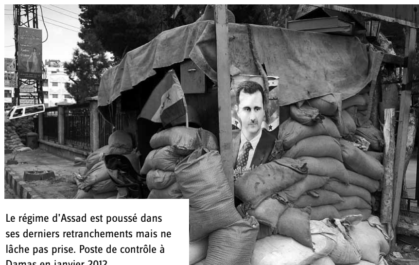
Le régime d'Assad est poussé dans ses derniers retranchements mais ne lâche pas prise. Poste de contrôle à Damas en janvier 2012.

financés et armés par des pays ou organisations islamistes, ce qui les incite à s'afficher plus radicaux qu'ils ne le sont. Nicolas Hénin, pour expliquer le succès de l'IS et la radicalisation en général, a recours à une fable, « l'histoire d'un petit élève qui, à chaque récréation, se faisait cas-