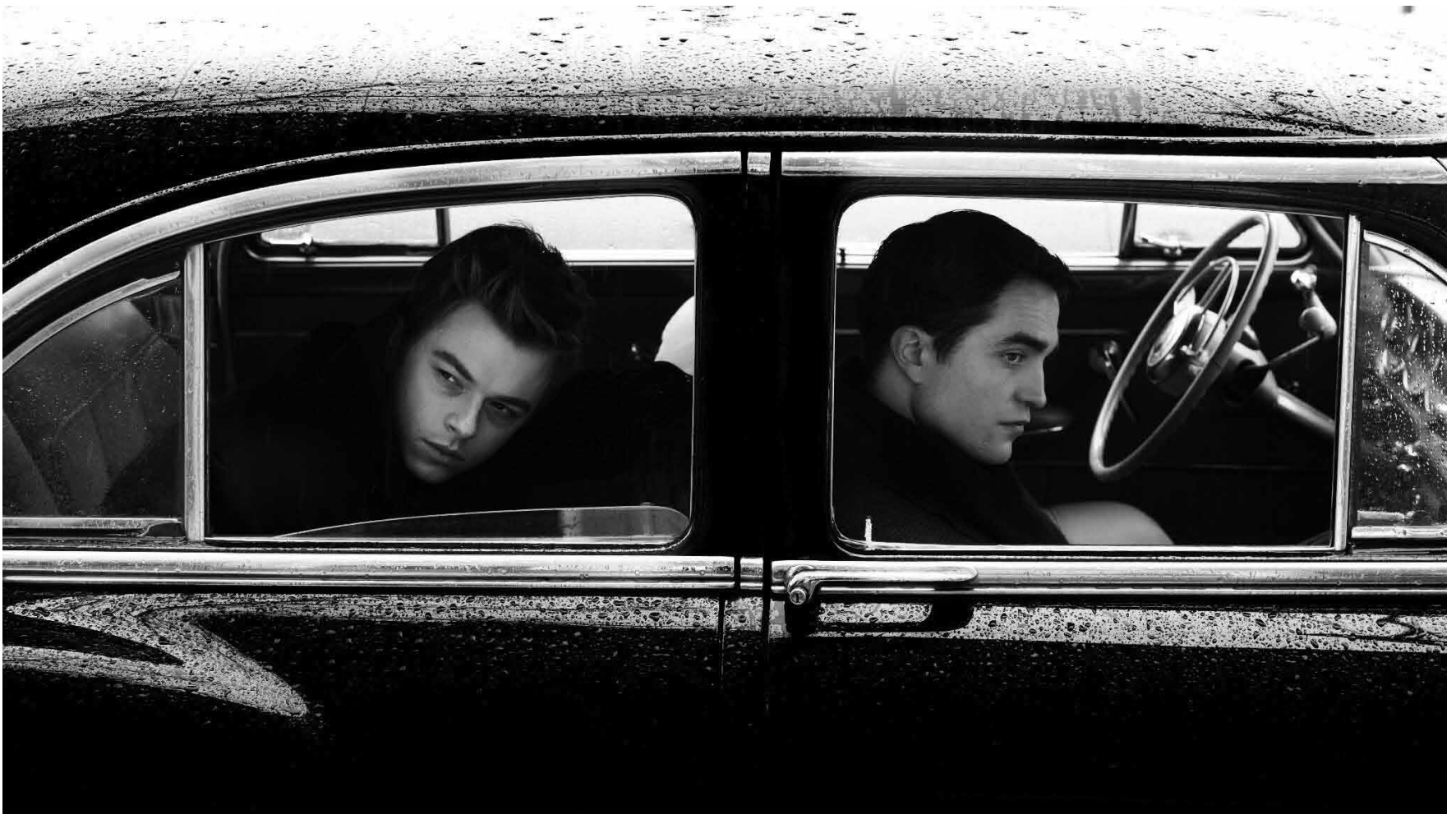
Wenigstens spielt er nicht James Dean... Robert Pattinson in „Life“, dem Porträt des Ausnahmeschauspielers - neu im Utopia.