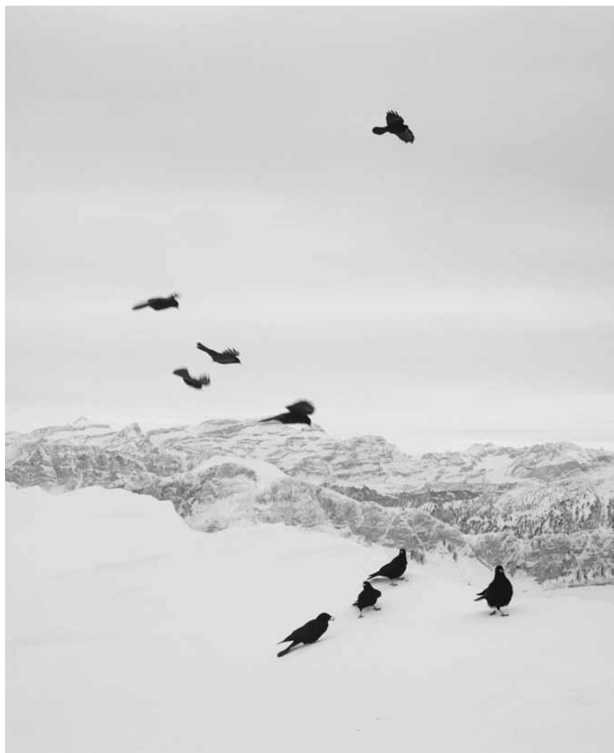
Die Fotografien der aus New York stammenden Fotografin Sonia Braas zieren die „Arcades II“ in Clervaux: „You Are Here“ - noch bis zum 16. September 2016.