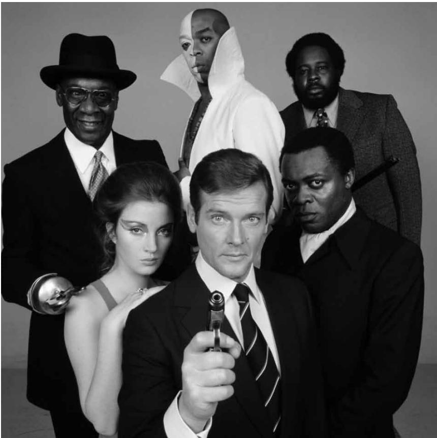
There's more, much more - Roger Moore! En attendant le nouveau James Bond, les classiques « Live and Let Die » et « The Spy Who Loved Me » seront au Kursaal cette semaine.

Le nozze di Figaro opéra de Wolfgang Amadeus Mozart. Avec Anita Hartig et Erwin Schrott. 195' avec un entracte. En italien avec sous-titres angl. Retransmission en direct du Royal Opera House, Londres.