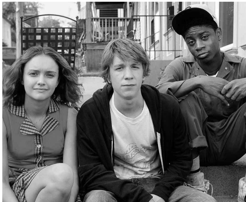
Liebe, Tod und Filmemachen - „Me and Earl and the Dying Girl“ kombiniert das alles zu einer bitterzarten Jugendkomödie - neu im Utopia.

Zu Beginn des 20. Jahrhunderts nimmt die politische Frauenrechtsbewegung in Großbritannien ihren Anfang. Die Aktivistin Emmeline Pankhurst etabliert sich im Jahr 1903 mit der Gründung der „Woman's Social and Political Union“ als Vorreiterin dieser Bewegung. Doch der Staat reagiert immer brutaler auf die öffentlichen Proteste. Die demonstrierenden Frauen gehören größtenteils zur Arbeiterklasse und riskieren bei ihrem Kampf für das Wahlrecht und die allgemeine Gleichstellung der Frau alles. Als die friedlichen Auflehnungen nichts bewirken, schlagen einige Frauen, darunter die entschlossene Maud, schließlich radikalere Wege ein.