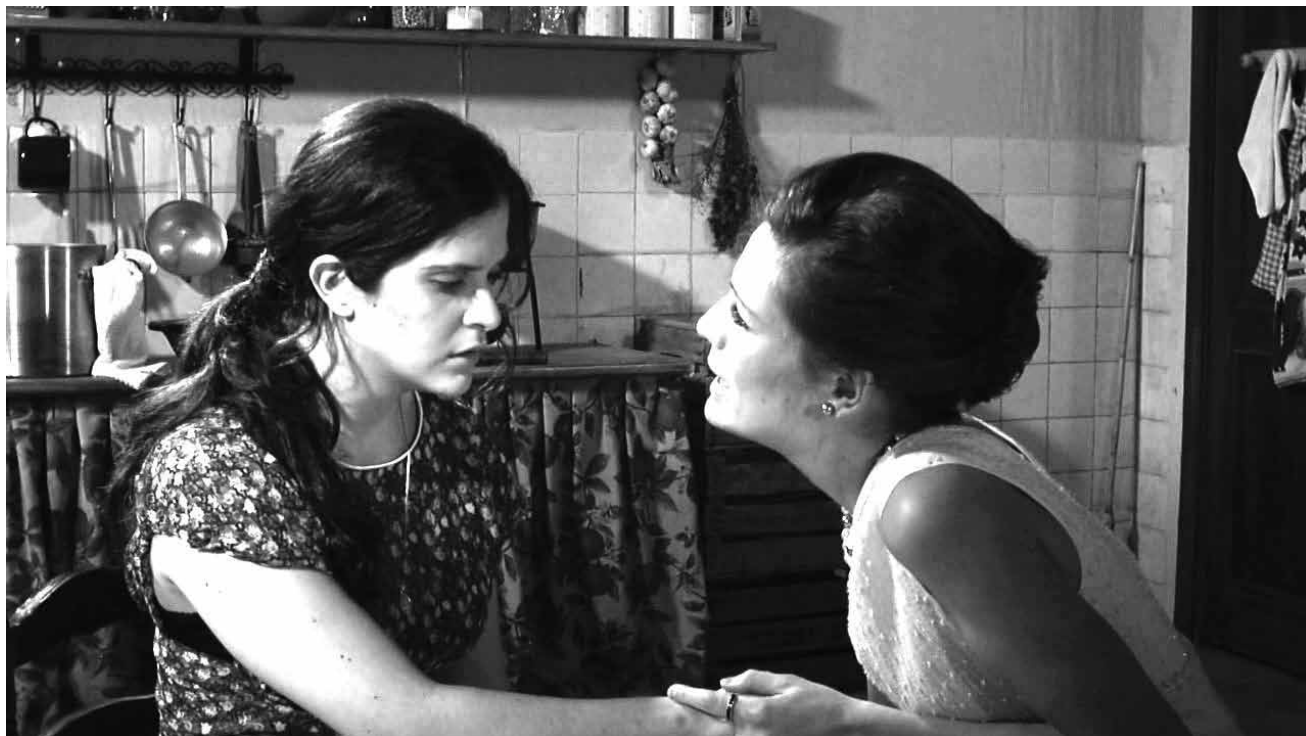
Portrait d'une famille madrilène des années 1960 : « El Mundo sigue », de Fernando Fernán Gómez, vendredi à la Cinémathèque.

Même si la celle-ci est absente du film, il en reste un parfum de l'Orient brûlant et fascinant. Pasolini est allé à travers l'Asie et l'Afrique, en Érythrée, au Népal, au Yémen, en Iran, à la recherche de ses décors et de ses personnages. Il les voulait à l'écart des circuits touristiques, comme préservés de l'histoire, surprenants et vrais.