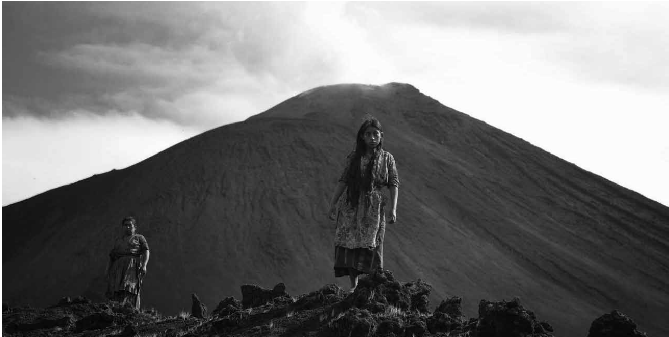
Dans « Ixcanul » le réalisateur Jayro Bustamante raconte les déboires d'une jeune Maya au Guatemala - qui vit entre son village et la ville. Nouveau à l'Utopia.

Une grande prairie, un rassemblement country western quelque part dans l'est de la France. Alain est l'un des