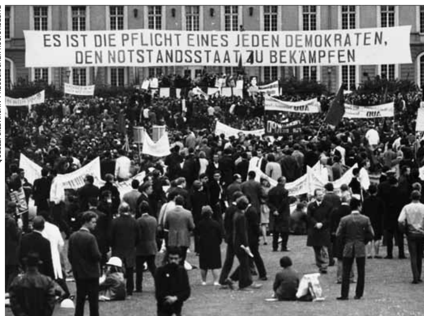
Notstandsgesetze haben einen schlechten Ruf: In Deutschland etwa führten die Debatten von 1968 zu massiven Protesten der „Außerparlamentarischen Opposition“ (APO), die darin eine Einschränkung demokratischer Grundrechte sah.