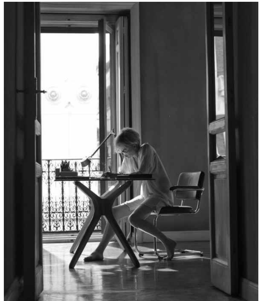
Trois femmes et des destins croisés - on est bien dans l'univers de Pedro Almodóvar : « Julieta », nouveau à l'Utopia.

Nachdem sein leiblicher Vater Li auf der Bildfläche erscheint, nimmt er Po mit in sein ebenso entlegenes wie paradiesisches Dorf voller tollpatschiger Pandas. Doch die Idylle wird durch den mit übernatürlichen Kräften ausgestatteten Schurken Kai bedroht, der sich ein fürchterliches Ziel gesetzt hat: Er will jeden einzelnen Kung-Fu-Meister in China vernichten. Also ist es an Po, aus seinen gemütlichen Verwandten mutige, selbstsichere Kämpfer zu machen.