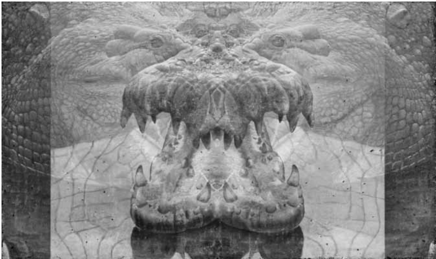
Er verschont weder Mao, Buddha noch Putin: Der deutsche Maler Eric Peters stellt im Ikob in Eupen aus: „Überall“ - noch bis zum 24. Juli.

Musée national de la Résistance (place de la Résistance, tél. 54 84 72), Esch-sur-Alzette, ma. - di. 14h - 18h.