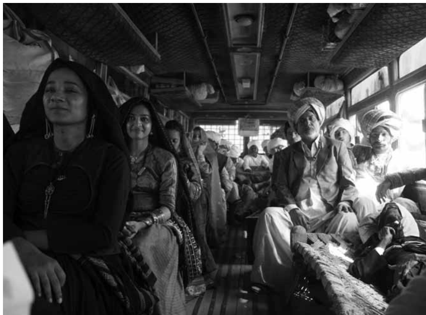
Un film indien indépendant qui s'aventure là où Bollywood met rarement les pieds : « Parched », sur l'émancipation des femmes, nouveau à l'Utopia.

Stoessel, Jorge Blanco et Mercedes Lambre. 90'. V.o.