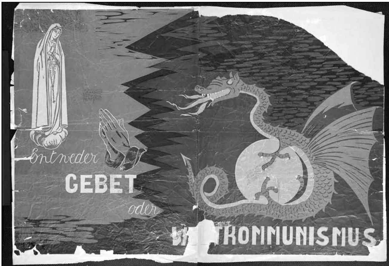
Entscheidungsdruck im Kalten Krieg. Die Muttergottes als Schutzpatronin der freien Welt, der Kommunismus als Drache statt als Gespenst. Ausstellung „La guerre froide au Luxembourg“ im MNHA.

www.museum-am-dom-trier.de , bis zum 16.10., Di. - So. 10h - 18h.