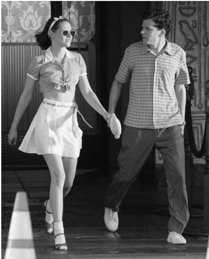
Un duo assorti, et pourtant... Kristen Stewart et Jesse Eisenberg dans « Café Society ».