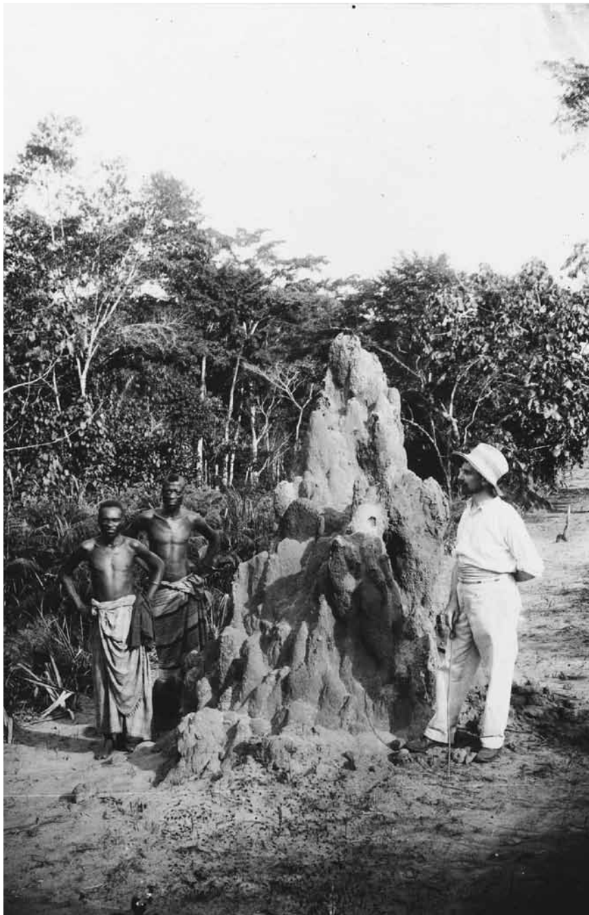
Au temps béni des colonies... L'Abbaye de Neumünster montre les travaux du photographe et botaniste Edouard Luja qui s'est aventuré au Congo belge - jusqu'au 26 juin.

jusqu'au 29.5, me. - ve. 11h - 20h, sa. - lu. 11h - 18h.