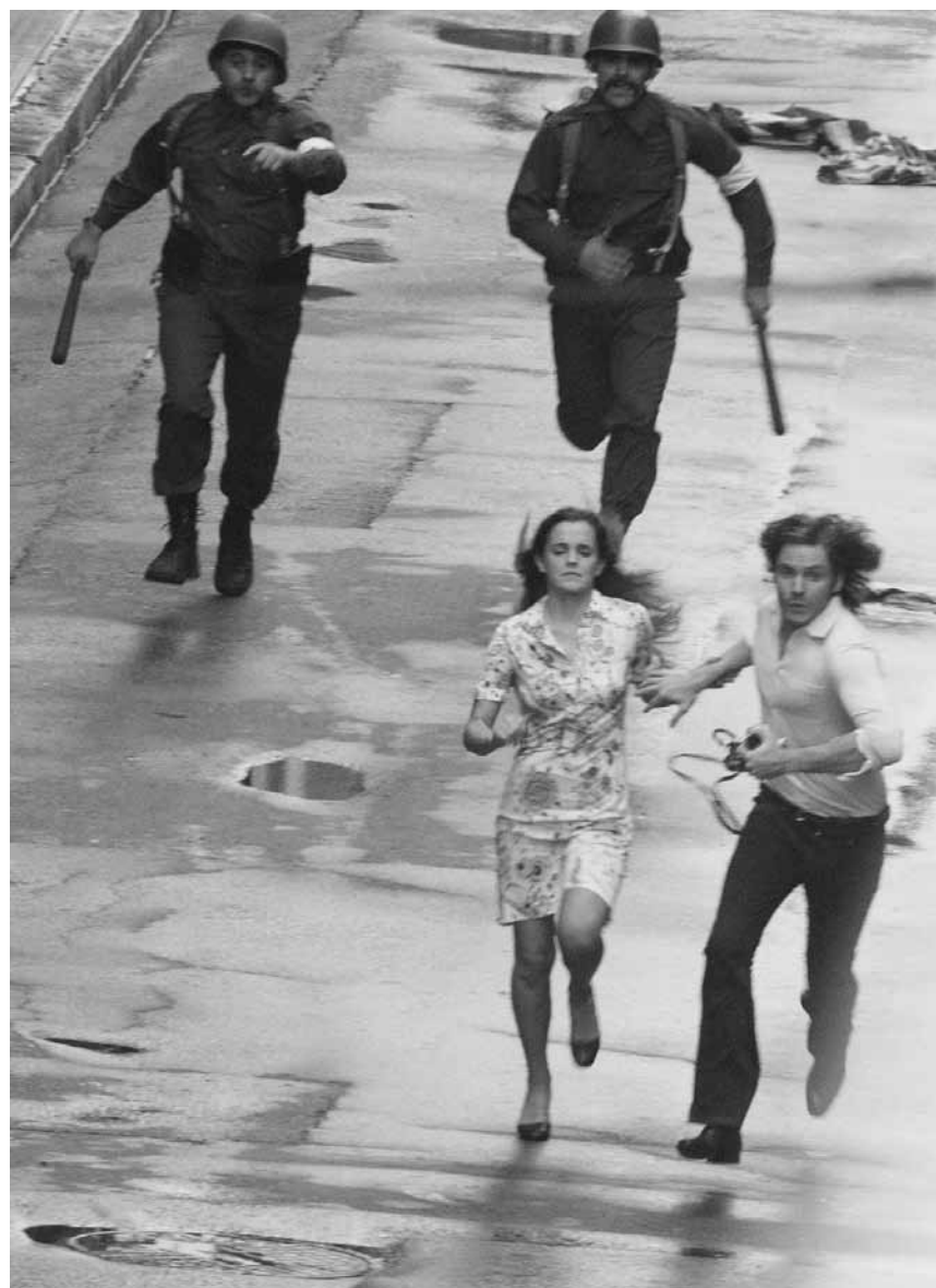
Deutscher Kulturexport at its very worst: „Colonia“ - im Le Paris, Orion, Prabbeli, Starlight, Sura und Utopia.

D 2015 von Lars Kraume. Mit Burghart Klaußner, Ronald Zehrfeld und Lilith Stangenberg. 106'. O.-Ton. Ab 12.