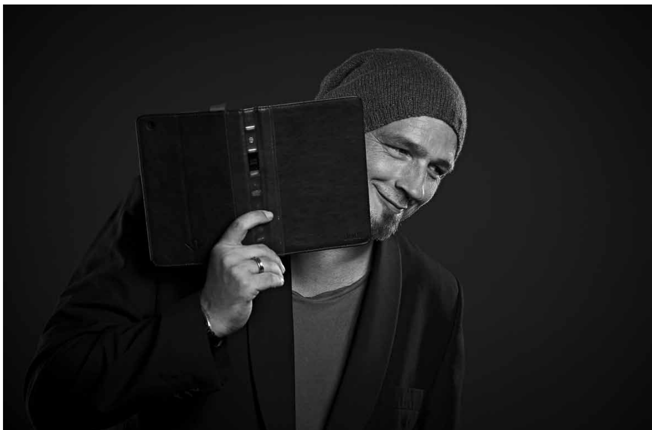
Kommt flapsig rüber, zielt aber meistens ins Schwarze: Der Comedian Torsten Sträter macht am 27. Mai im Cube 521 in Marnach halt.

Alte Feuerwache, Saarbrücken (D) , 19h30. Tel. 0049 681 30 92-0.