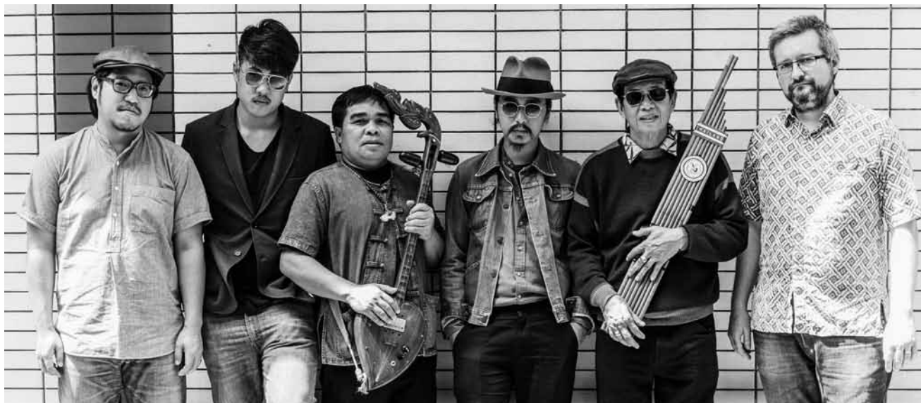
Des sons paradisiaques aux Rotondes - probablement le meilleur truc à faire avec ce temps pourri - « The Paradise Bangkok Molam International Band », le 15 juin.

Quand le blocage géographique empêche les consommateurs de faire leurs achats en ligne , Centre d'information européen de la Maison de l'Europe (7, rue du Marché-aux-Herbes), Luxembourg , 12h30.