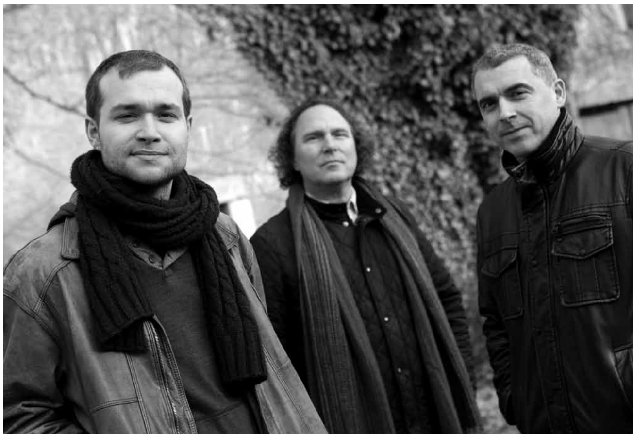
Le jazz, pour eux, c'est quelque chose d'organique : « Organic Trio », le 12 juin à l'abbaye de Neumünster.

Studio des Theaters, Trier (D) , 16h. Tel. 0049 651 7 18 18 18.