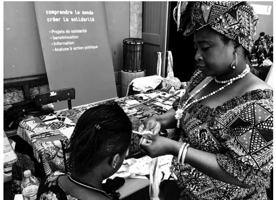
Ce samedi, la Kulturfabrik se met à l'heure africaine avec l'« Afrikafest » - des concerts, des spectacles de danse et des workshops vous y attendent.