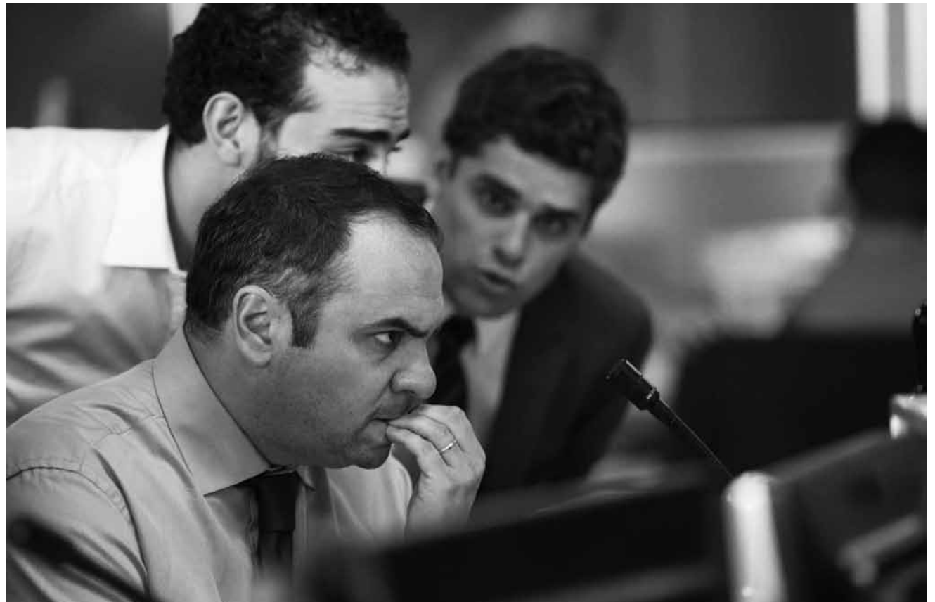
La Société générale ne vous encourage pas à aller voir « L'Outsider », l'histoire du trader Jérôme Kerviel. Nouveau à l'Utopolis Kirchberg.

Jérôme est né en 1977 dans une banale bourgade de pêcheurs du Finistère. Adolescent sans histoire, il mène une vie ordinaire avec son frère et ses parents, un couple uni et travailleur. Il suivra des études convenables qui le mèneront à un DESS de finance. Il est recruté en 2000 par la Société générale où on l'affecte au « middle office », sorte de secrétariat chargé de comptabiliser les ordres passés par les prestigieux traders qui officient dans la mythique salle des marchés, considérée à l'époque comme la meilleure au monde sur les produits financiers dérivés.