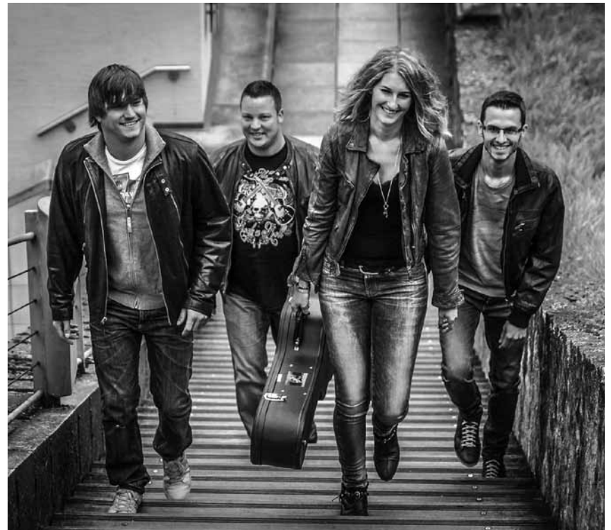
Am Diddelenger Parc Le'h ass dëse Freideg, den 8. Juli nees eng Summerbühn opgeriicht, do trieden ënnert aneerm Go by Brooks op.