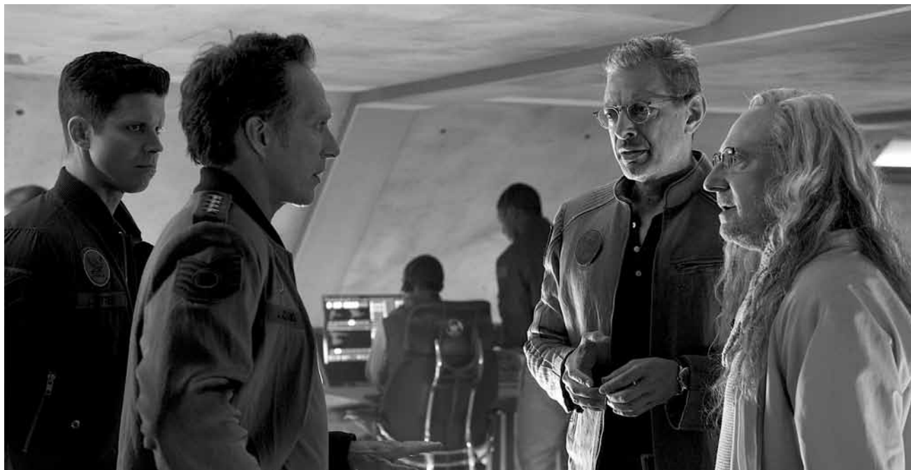
Einmal die Alien-Platte frisch aufgekocht bitte: „Independence Day: Resurgence“ - neu in den Sälen.

automatique mode « thriller ». La musique omniprésente finit notamment par agacer dans sa volonté de forcer les sentiments. Une adaptation mineure de John le Carré donc, sans véritable esthétique ni profondeur humaine, et qui séduira au mieux les inconditionnels de l'espion britannique. (ft)