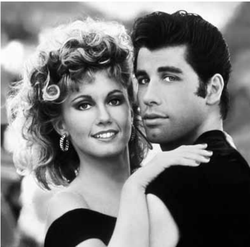
Manche lieben es fettig: „Grease“ am Samstag im Open Air Cinema am Palast.

Danny ist Anführer der coolen „T-Birds“ vom Rydell-College. Während eines Strandurlaubs hat er einen Flirt mit Sandy die nach den Ferien das College wechselt und in Rydell landet. Da hat Danny ein Problem und will nichts von ihr wissen. Sandy wird Mitglied der Frauengang „Pink Ladies“.