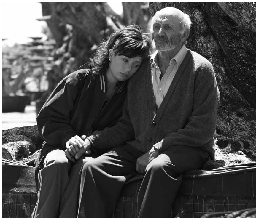
Un arbre millénaire et un combat contre les multinationales : « El olivo » promet d'être un film explosif - nouveau à l'Utopia.

Sohn Nemo geholfen hat, beginnt die Dame mit dem Gedächtnisproblem sich bruchstückhaft an ihre Kindheit zurückzuerinnern. Vor allem der Gedanke an das Juwel von Morro Bay in Kalifornien schleicht sich immer wieder in ihren Kopf ein. Also schwimmt sie zusammen mit Nemo und Marlin los, um den Wunsch vom Wiedersehen mit ihrer verlorengelaubten Familie doch noch wahr werden zu lassen.