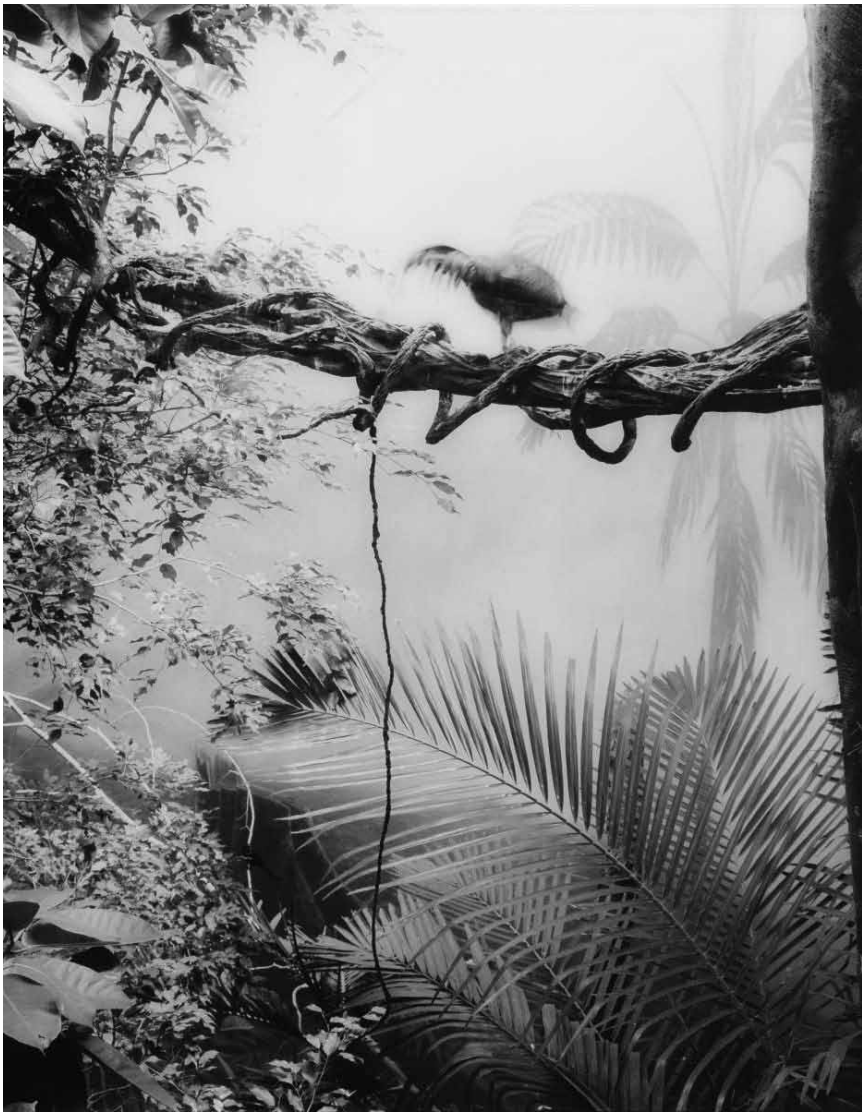
C'est à la recherche du paysage naturel - mais existe-t-il vraiment ? - que nous entraîne Sonja Braas dans les arcades de Clervaux avec « You Are Here », jusqu'au 16 septembre.

(montée du Château, tél. 92 96 57), Clervaux, me. - di. + jours fériés 12h - 18h.