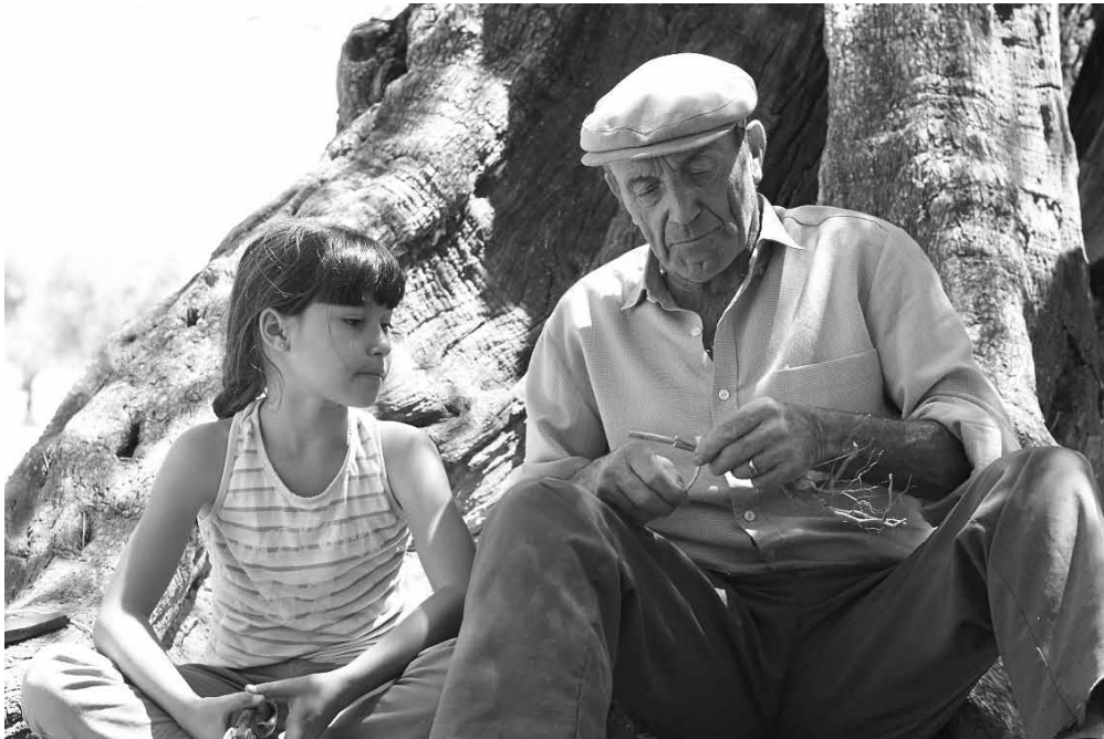
L'apprentissage de la greffe : par-delà les générations, l'olivier fait croître les relations humaines.