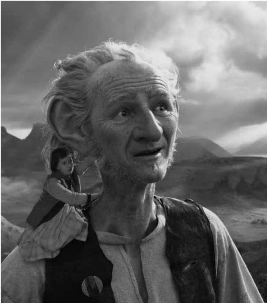
Ce géant-là est tellement sympathique qu'il ne mange même pas de chair humaine ! Spielberg revient aux fantaisies oniriques avec « The BFG », d'après l'histoire de Roald Dahl. Nouveau aux Paris, Prabbeli, Scala, Starlight, Sura, Utopolis Belval et Kirchberg.

Truman E/ARG 2015 de Cesc Gay. Avec Ricardo Darín, Javier Cámara et Dolores Fonzi. 108'. V.o. cat., s.-t. fr. + nl. À partir de 6 ans.