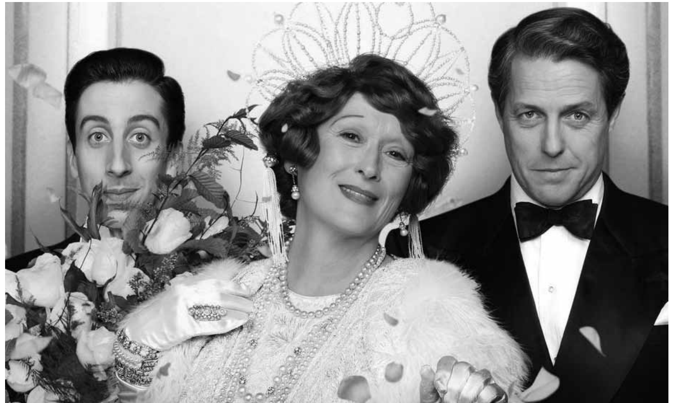
Elle a inspiré « Marguerite » l'année dernière avec Catherine Frot, voici maintenant « Florence Foster Jenkins » incarnée par Meryl Streep. Un film qui colle beaucoup plus à la biographie de la cantatrice qui chantait faux - nouveau à l'Utopia.

Alma, jeune femme engagée, reprend l'exploitation agricole de son grand-père. Ce dernier a été contraint de vendre son olivier millénaire à une multinationale et ne s'en est jamais remis. Alma décide de renverser l'ordre établi et remonte la piste de cet arbre unique, dernier ancrage dans ses terres familiales. Ce voyage