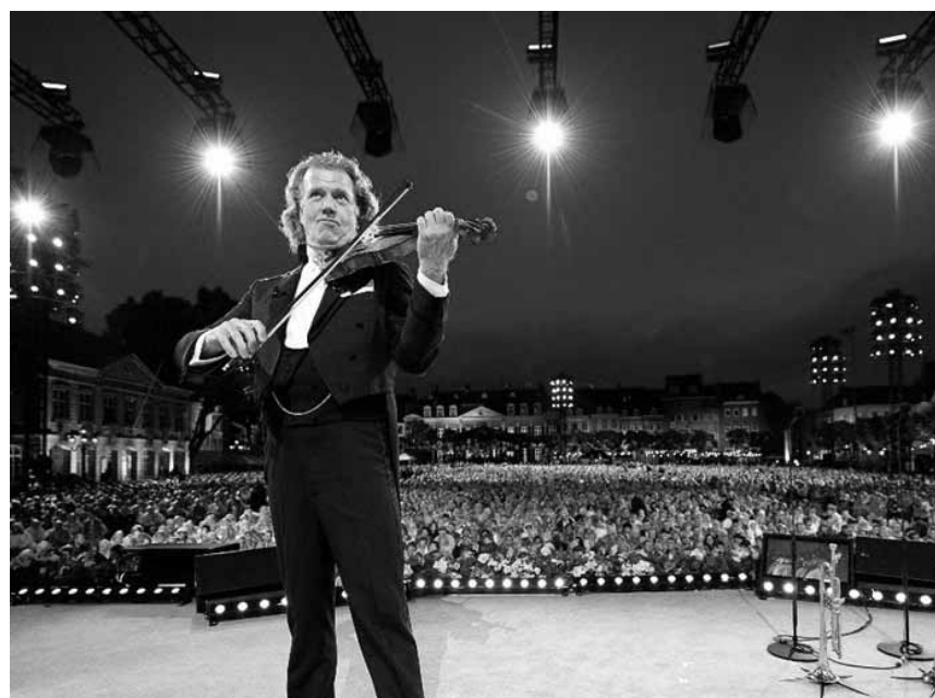
Alle Jahre wieder - geigt sich André Rieu durch die Kinosäle: So auch an diesem Samstag, dem 23. Juli im hautstädtischen Utopia.