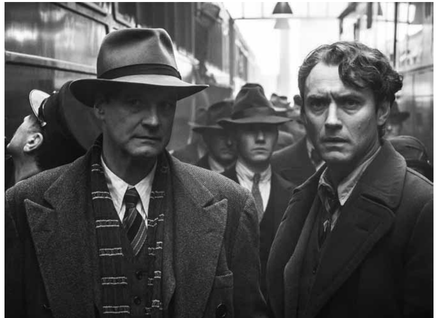
In einer Zeit als noch ordentlich lektoriert wurde: „Genius“ erzählt die schwierige Beziehung zwischen Lektor Max Perkins und Autor Thomas Wolfe - neu im Utopia.

Biopic über das Leben und Schaffen von Florence Foster Jenkins, die als schlechteste Opernsängerin aller Zeiten in die Geschichte einging - wegen ihres furchtbaren Gesangs. Ihr Manager St Clair Bayfield versucht Florence vor der unbequemen Wahrheit zu schützen. Das wird besonders schwer, als die Sängerin