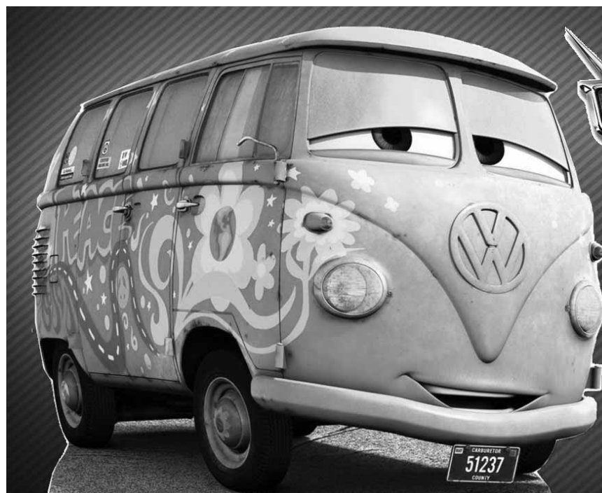
Presque un oldtimer du film d'animation : « Cars » réalisé en 2006 par John Lasseter - séance spéciale à l'Utopolis Kirchberg.