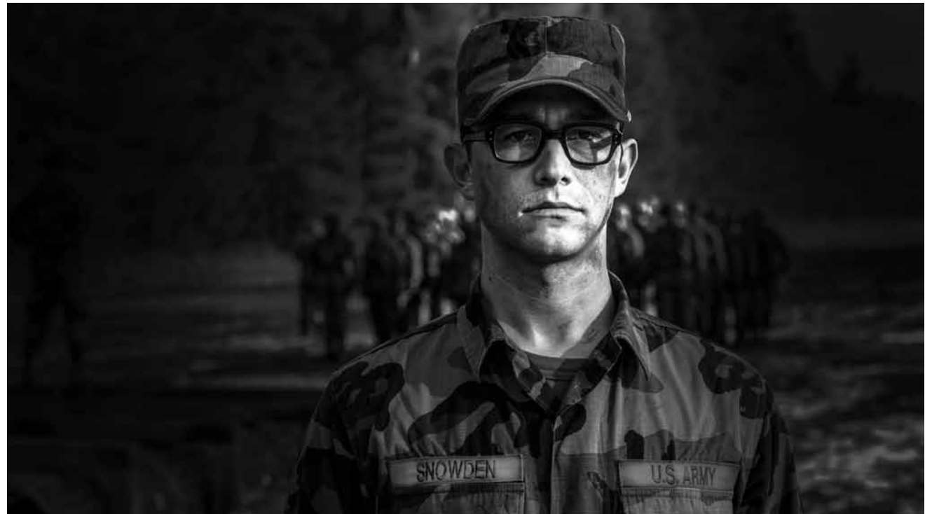
„Snowden“ aussi a eu droit à son biopic dirigé par Oliver Stone - nouveau à l'Utopolis Kirchberg.

Im Internet macht ein neues, illegales Spiel namens „Nerve“ die Runde, bei dem die Teilnehmer riskante Herausforderungen meistern müssen,