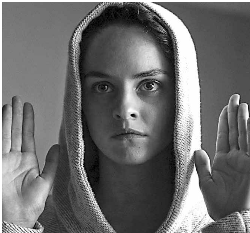
Premier film français à documenter l'embrigadement djihadiste des jeunes filles particulièrement : « Le ciel attendra » - nouveau à l'Utopia.

F 2016 de François Ozon . Avec Pierre Niney, Paula Beer et Ernst Stötzner . 113'. V.o. À partir de 12 ans.