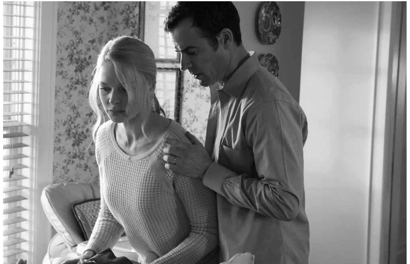
„The Girl on the Train“ - ein klassisches Verwirrspiel das wohl auch Altmeister Hitchcock gefallen hätte - neu im Utopolis Belval und Kirchberg.

Winfried ist ein 65-jähriger, einfühlsamer Musiklehrer mit Hang zu Scherzen, der mit seinem alten Hund zusammenlebt. Seine Tochter Ines hingegen ist das Gegenteil: Als ehrgeizige Unternehmensberaterin reist sie um die Welt und von einem Projekt zum nächsten, um die Karriereleiter steil nach oben zu klettern. Vater und Tochter bekommen sich daher nicht oft zu sehen, aber das wird schlagartig anders, als Winfrieds Hund stirbt und er daraufhin beschließt, Ines unangekündigt bei der Arbeit in Bukarest zu besuchen. XXX Sicher die Überraschung des Kinojahres: Ein skurriler Film mit eigenständigem Humor, der nichts verspricht doch alles hält. (lc)