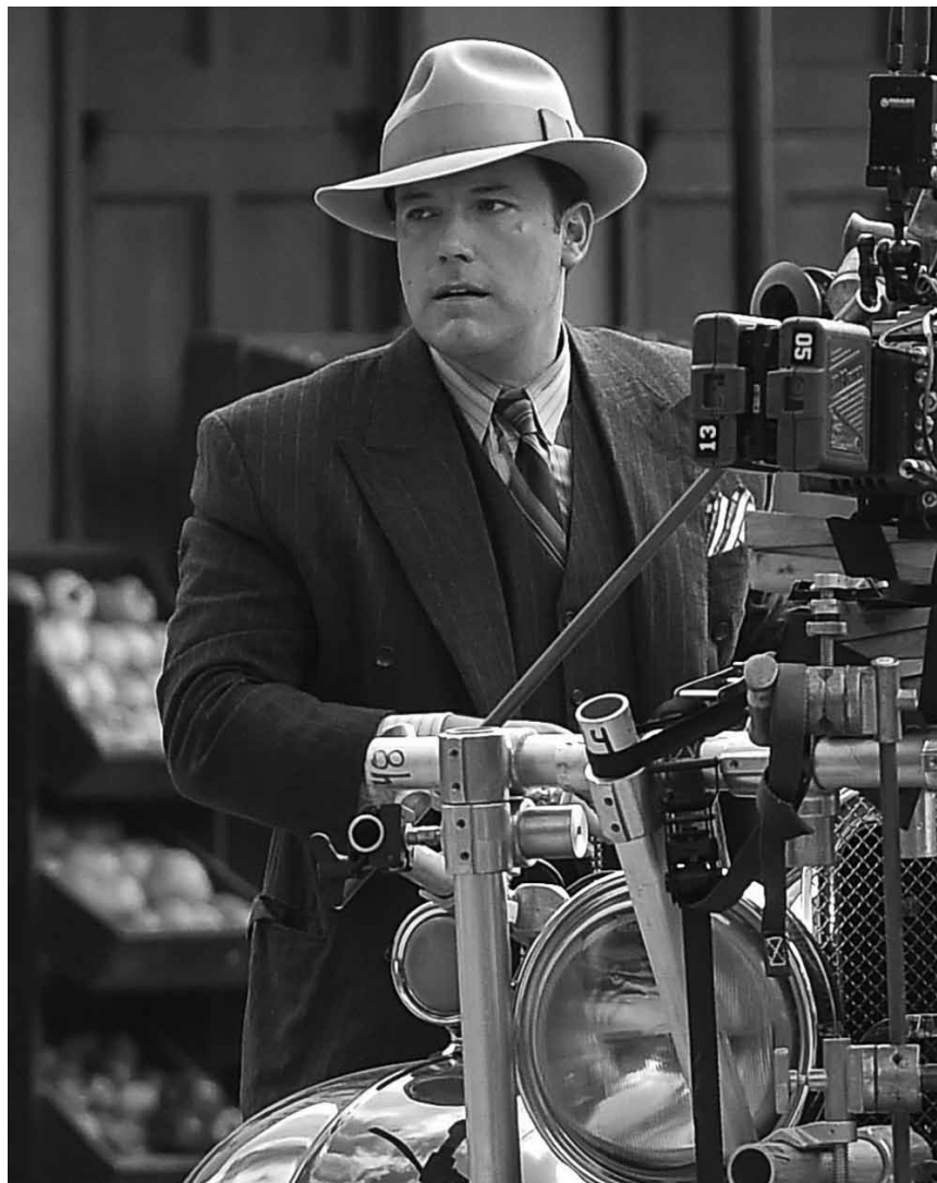
Ob das Amerika der 1920er-Jahre rauer war, als die Trump-Ära, die an diesem Freitag über uns hereinbricht? „Live by Night“ hilft beim Vergleichen - neu im Utopolis Belval und Kirchberg.

Schwere Körperverletzung, Besitz gestohlener Güter, Fälschung imperialer Dokumente - Jyn Erso hat eine Reihe Schandtaten in ihrem Lebenslauf, als sie von den Rebellen angeheuert wird. Andererseits war Jyns Vater Galen Erso maßgeblich daran beteiligt, die neue Superwaffe des Imperiums zu bauen, weswegen sein Insiderwissen und Jyns Verbindung zu ihm wertvoll sind. Insofern ist