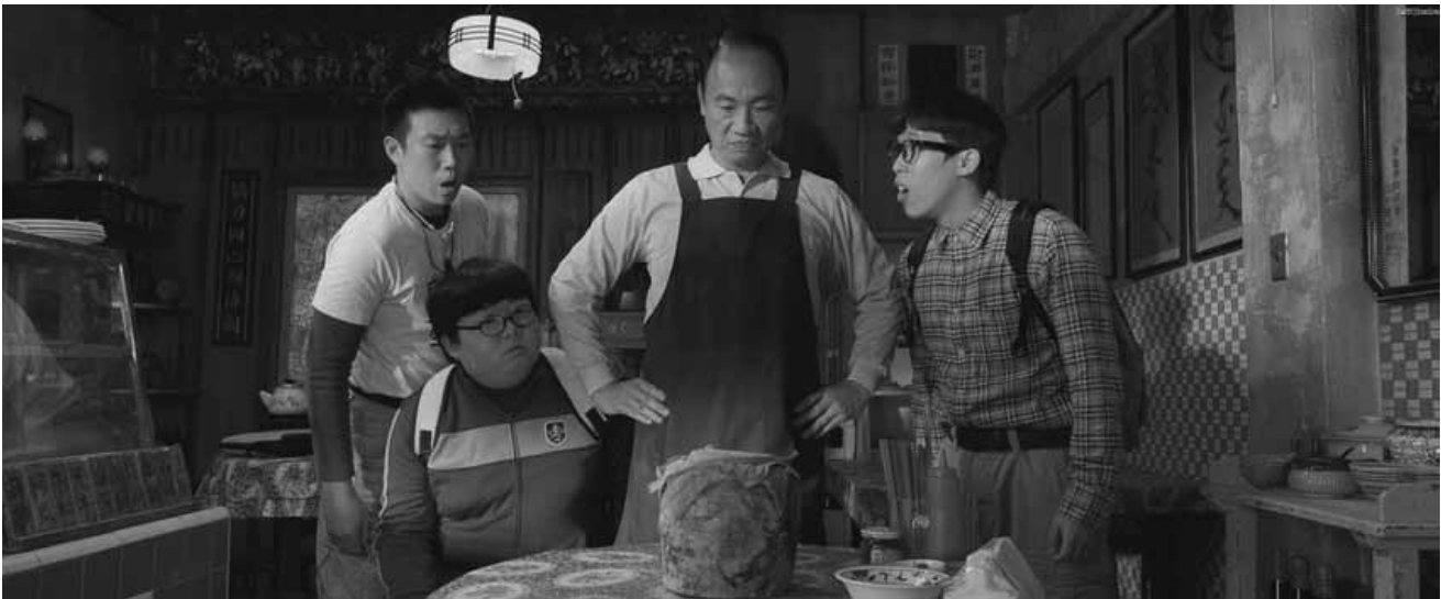
Reviving the outdoor banquet business is not as easy as it sounds... "Zong pu shi" will be shown Saturday at the Cinémathèque.

un accident qui en a fait un simple d'esprit.