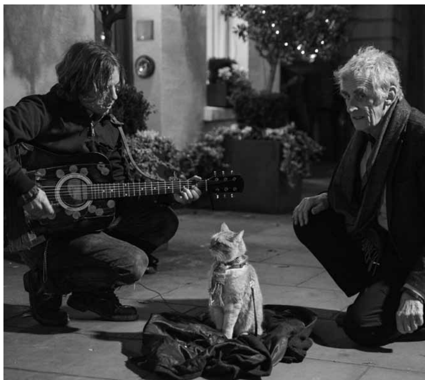
In „A Street Cat Named Bob“ mausert sich ein streunender Kater zum Sozialarbeiter - neu im Utopia.