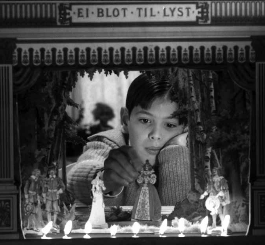
Un Noël classique : « Fanny och Alexander » d'Ingmar Bergmann, samedi à la Cinémathèque.