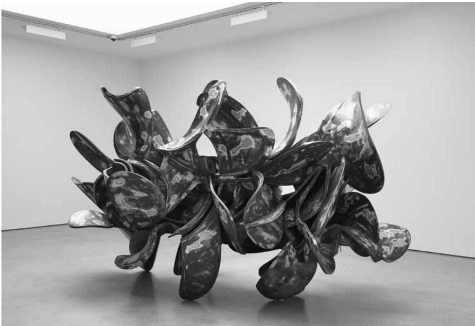
« Industrial Nature », 2015.

© ADAGP 2017, PARIS / TONY CRAGG