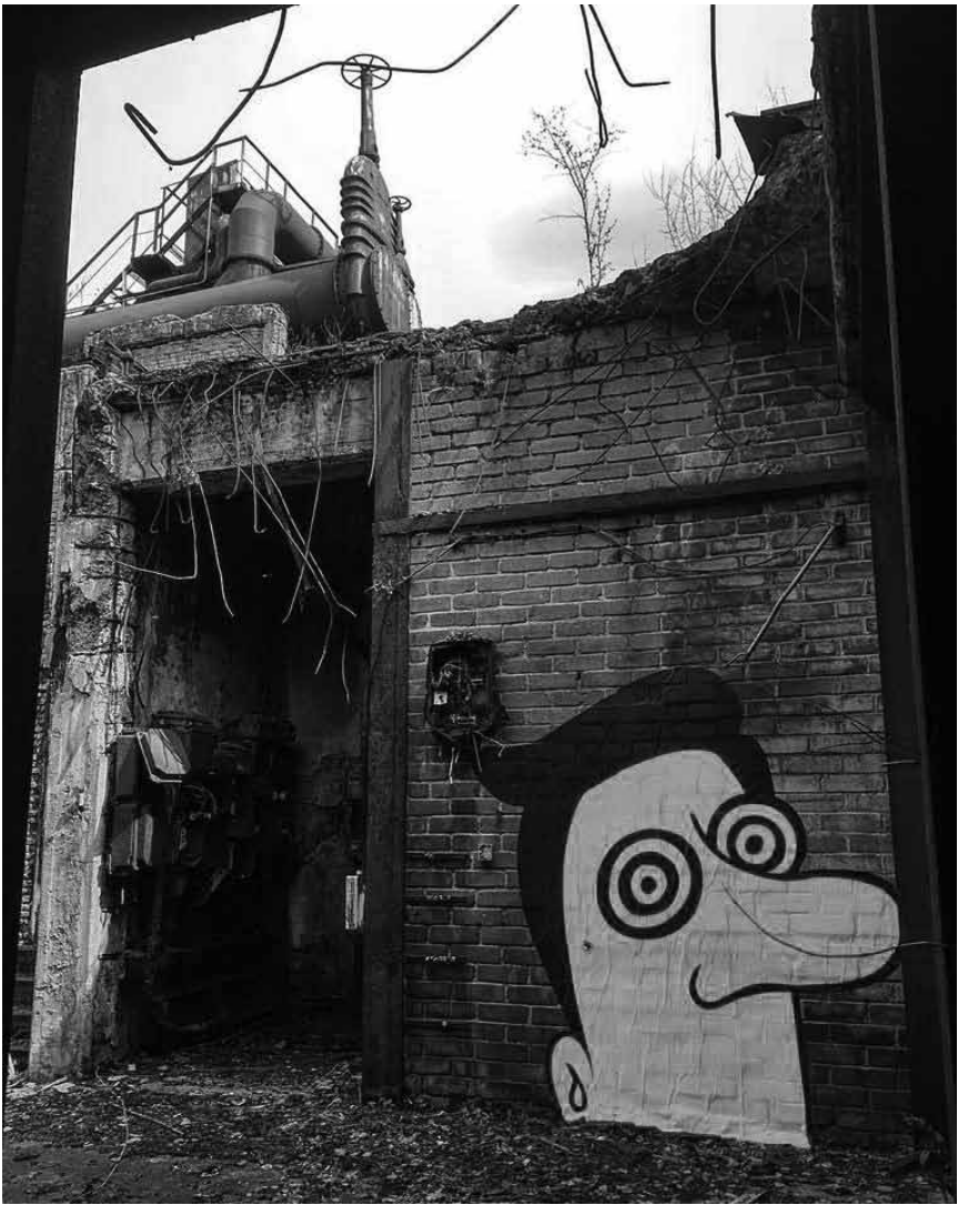
Nicht nur in der Kulturfabrik gibt es „Urban Art“ - auch die Völklinger Hütte zeigt städtische Kunst, bis zum 5. November.

Saarart 11 kollektive Ausstellung von acht KünstlerInnen, Saarländisches Künstlerhaus (Karlstraße 1, Tel. 0049 681 37 24 85), bis zum 18.6., Di. - So. 10h - 18h.