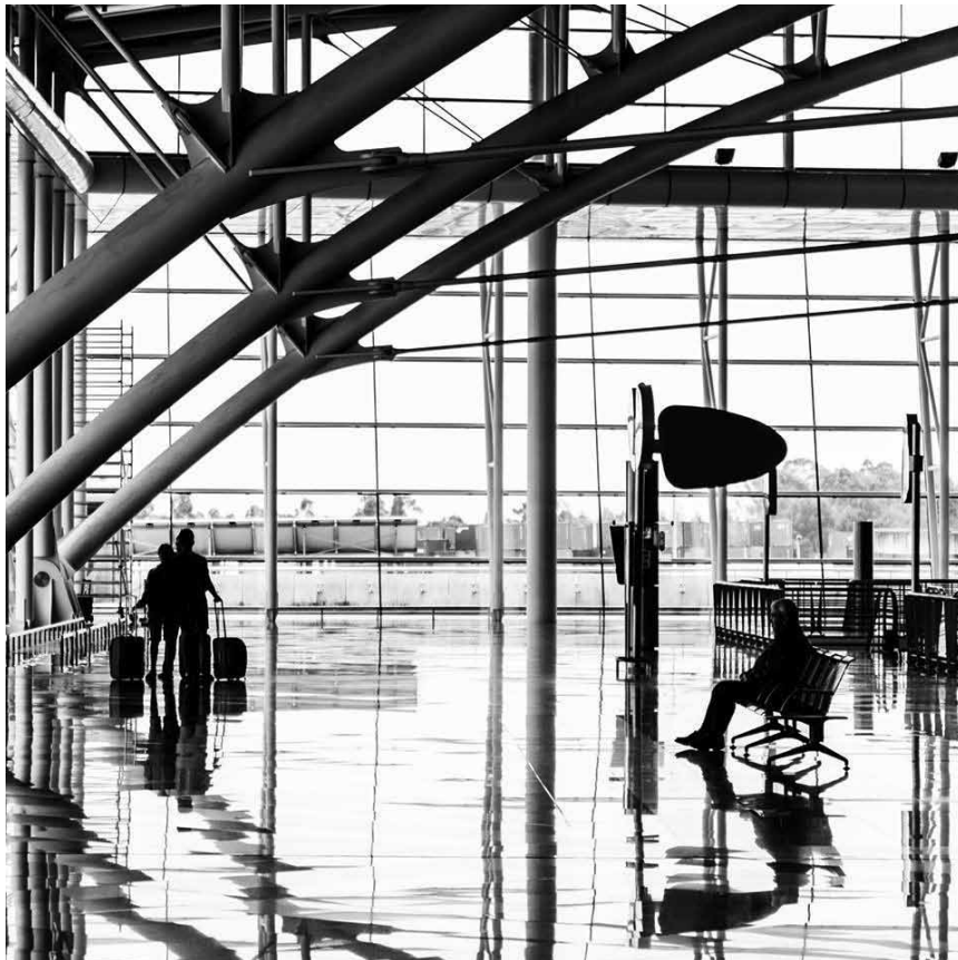
Quand les restos deviennent des galeries... « Art Bites » photos de Mikka Heinonen au Lagura jusqu'au 13 mai.