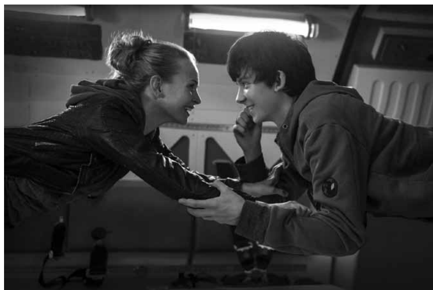
Liebesgrüße vom Mars: Ein auf dem roten Planeten aufgewachsener Teenager entdeckt ganz irdische Gefühle in „The Space Between Us“ - neu im Kinépolis Kirchberg.