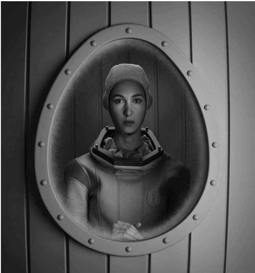
En marche ! pour les « Voyages extraordinaires » du photographe Christian Tagliavini, jusqu'au 29 septembre aux Arcades I à Clervaux.

Musée national de la Résistance (place de la Résistance, tél. 54 84 72), Esch-sur-Alzette, ma. - di. 14h - 18h. Musée national d'histoire naturelle (25, rue Münster, tél. 46 22 33-1), Luxembourg, me. - di. 10h - 18h, ma nocturne jusqu'à 20h. Musée national d'histoire et d'art (Marché-aux-Poissons, tél. 47 93 30-1), Luxembourg, ma., me., ve. - di. 10h - 18h, je. nocturne jusqu'à 20h. Lëtzebuerg City Museum (14, rue du St-Esprit, tél. 47 96 45 00), Luxembourg, ma., me., ve. - di. 10h - 18h, je. nocturne jusqu'à 20h. Nouvelle exposition permanente « The Luxembourg Story : plus de 1.000 ans d'histoire urbaine ». Musée d'art moderne Grand-Duc Jean (parc Dräi Eechelen, tél. 45 37 85-1), Luxembourg, je. - lu. 10h - 18h, me. nocturne jusqu'à 23h (galeries 22h). Musée Dräi Eechelen (parc Dräi Eechelen, tél. 26 43 35), Luxembourg, ma., je. - di. 10h - 18h, me. nocturne jusqu'à 20h. Villa Vauban - Musée d'art de la Ville de Luxembourg (18, av. Emile Reuter, tél. 47 96 49 00), Luxembourg, lu., me., je., sa. + di. 10h - 18h, ve. nocturne jusqu'à 21h. The Bitter Years (château d'eau, 1b, rue du Centenaire, tél. 52 24 24-303), Dudelange, me., ve. - di. 12h - 18h, je. nocturne jusqu'à 22h. The Family of Man (montée du Château, tél. 92 96 57), Clervaux, me. - di. + jours fériés 12h - 18h.