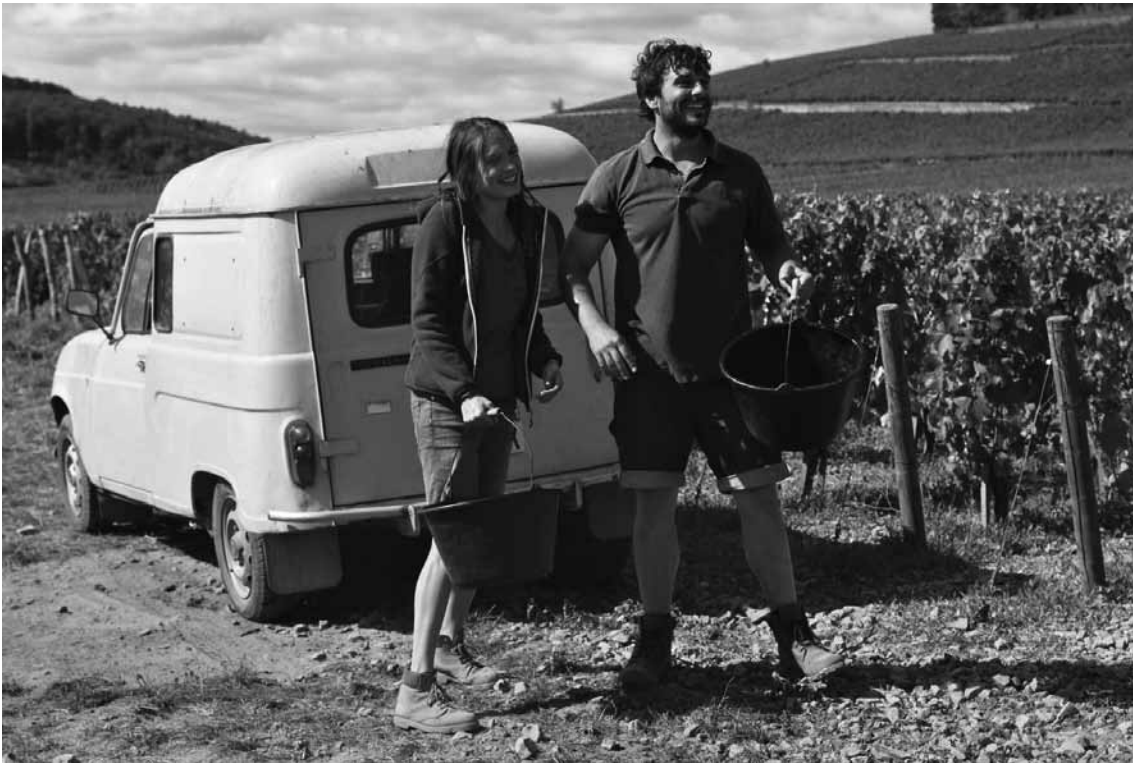
Après les funérailles du père, la fratrie renforce ses liens grâce à l'exploitation familiale.