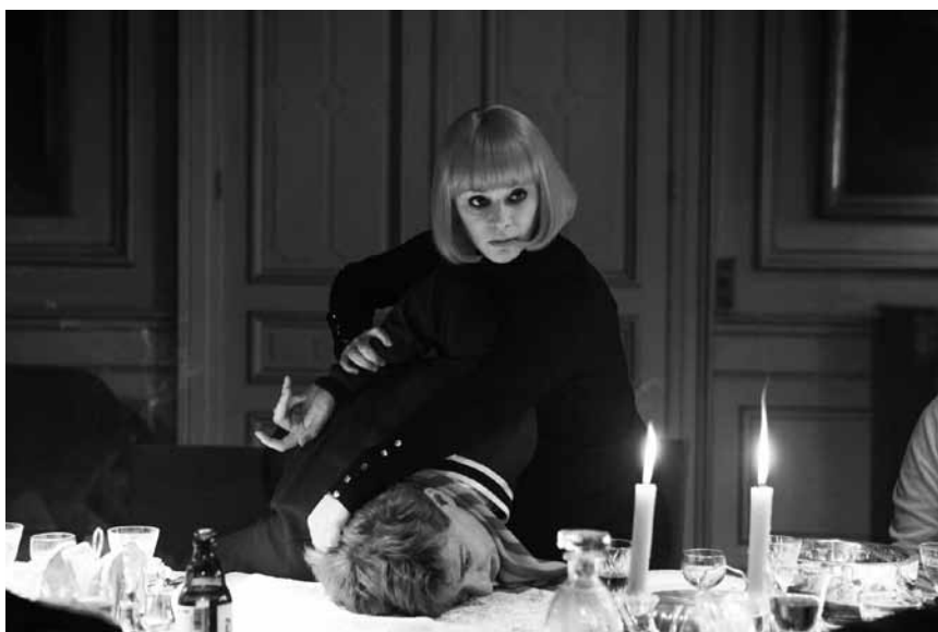
La boum va tourner très très mal : « Le manoir », film d'horreur bien franchouillard, est nouveau au Kinopolis Kirchberg.

Hanni und Nanni werden von ihrer Mutter Susanne auf das Internat Lindenhof geschickt, da sie beruflich für längere Zeit verreisen muss und es dem Vater der Mädchen nicht zutraut sich um die Zwillinge zu kümmern, ohne dabei ein komplettes Chaos anzurichten. Hanni und Nanni finden das überhaupt nicht in Ordnung und planen, sich so danebenzunehmen, dass sie noch