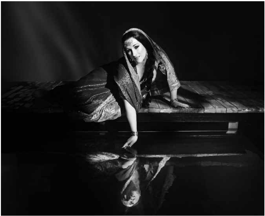
Le drame autour d'un triangle amoureux situé sur l'île de Ceylan, c'est l'argument de l'opéra de Bizet « Les pêcheurs de perles » - à l'Utopia, retransmission en direct du Metropolitan Opera à New York.

Les pêcheurs de perles USA 2017, opéra de Georges Bizet. Sous la direction de Gianandrea Noseda. Avec Diana Damrau, Matthew Polenzani et Nicolas Testé. 133'. V.o. + s.t. En direct du Metropolitan Opera, New York.