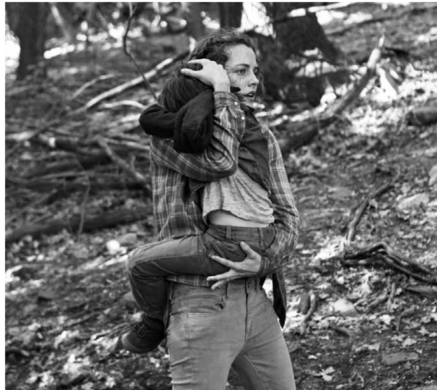
Für Survival-Fans aller Art: „It Comes At Night“ vermischt Horror und Thriller und das mitten im Wald - neu im Kinopolis Kirchberg.

Jean a quitté sa famille et sa Bourgogne natale il y a dix ans pour faire le tour du monde. En apprenant