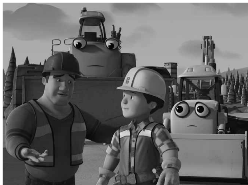
Die Baustellen in der Stadt kann man seinen Kindern nun wenigstens pädagogisch etwas näher bringen: „Bob The Builder“ - neu im Kinopolis Kirchberg und Belval.

Bob der Baumeister und seine treuen Helfer Baggi, Buddel und Heppo haben einen neuen, riesengroßen Auftrag: Ein alter, leerstehender Steinbruch