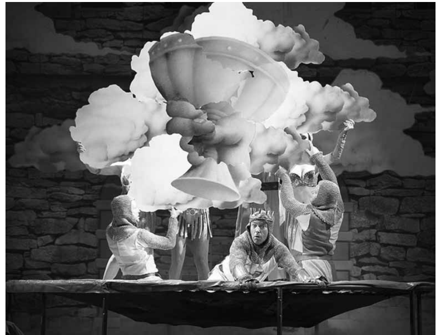
Lachen im Sommerloch? Mit „Monty Python's Spamalot“ im Zeltpalast in Merzig garantiert - am 18., 20., 22., 23. und 24. August.