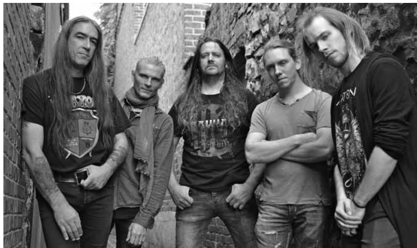
Cinq jeunes personnes plutôt sûres d'elles-mêmes : « We Rock ! », ce samedi 19 août au Spirit of 66 à Verviers.

History-Tour auf den alten Posttrouten , geführte Wanderung in historischen Szenen, Treffpunkt am Sportplatz (im Gewerbegebiet), Arzfeld (D) , 14h. Anmeldung: Touristinformation Arzfeld, Tel. 0049 65 50 96 10 80. www.500jahrepostroute.eu