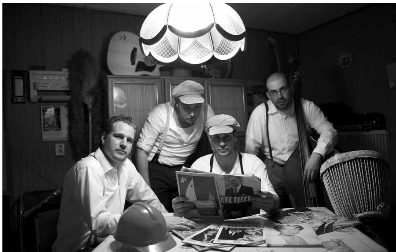
D'Kabaräsaison ass nees voll am Gaang, do dierfen d'„Dëppegeïsser“ net feelen – dëse Samstag, de 25. November spille si am Kulturhaus Niederanven.

Ruppert Pupkin , Elektro-Folk, sparte4, Saarbrücken (D) ,