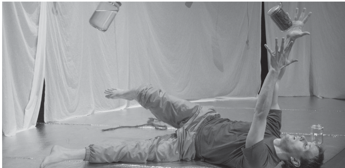
Ein Mann, seine Töpfe und sein innerstes Ich: „Potjesman“ ist Objekttheater für Kinder von anderthalb bis vier Jahren – an diesem Samstag, dem 25. November in den Rotondes.

Im Herzen tickt eine Bombe - Un obus dans le cœur , von Wajdi Mouawad, Werkstattinszenierung mit anschließendem Publikumsgespräch, Alte Feuerwache, Saarbrücken (D) , 19h. Tél. 0049 681 30 92-486. www.staatstheater.saarland Im Rahmen des Festivals Primeurs.