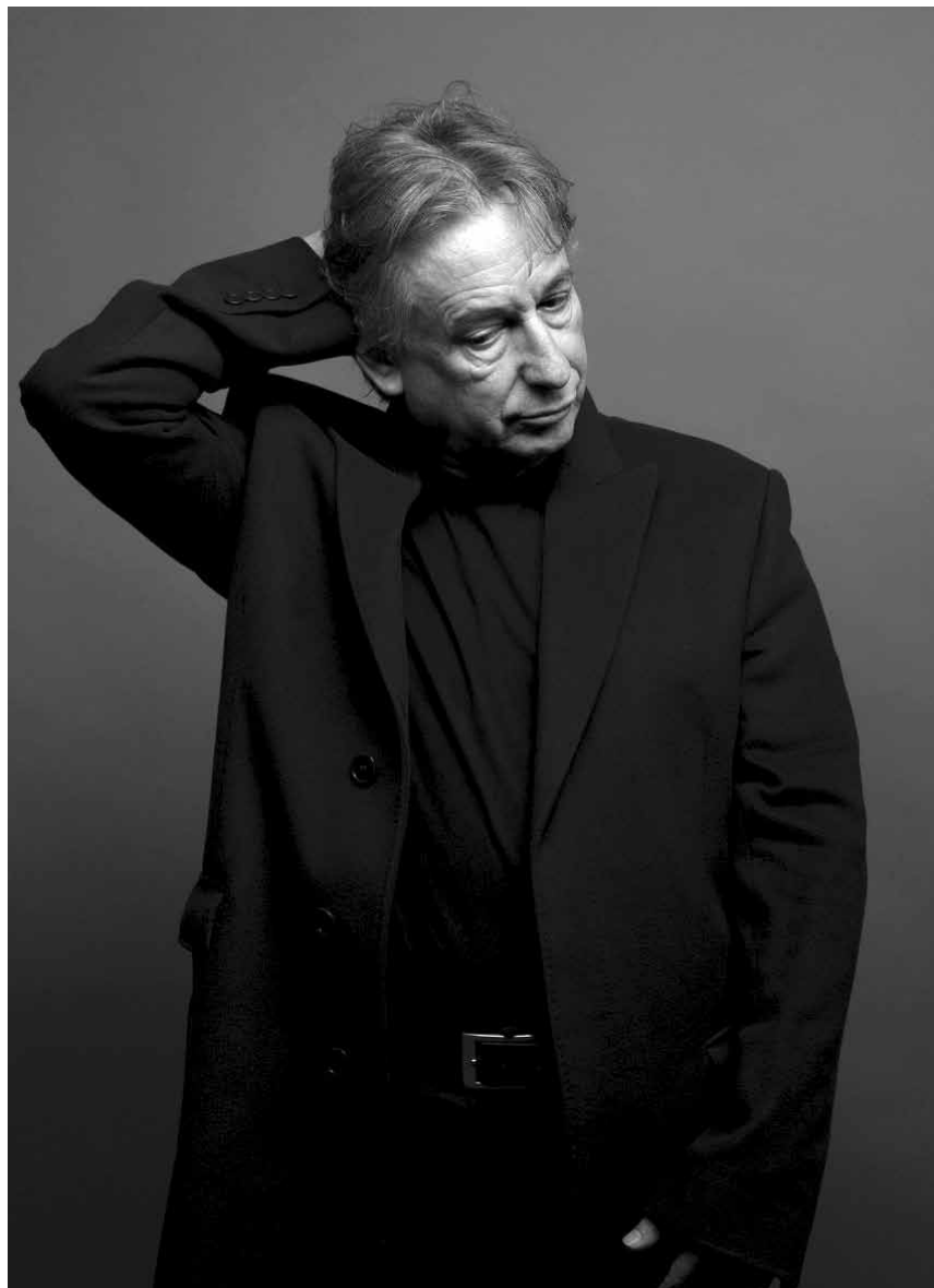
Prix Goncourt en 1990 pour « Les champs d'honneur », Jean Rouaud fera escale à la Bibliothèque nationale le 30 novembre pour discuter « Territoire, lieux et littérature-monde ».

Anne Queffélec , récital de piano, œuvres entre autres de Ravel, Mompou et Debussy, Arsenal,