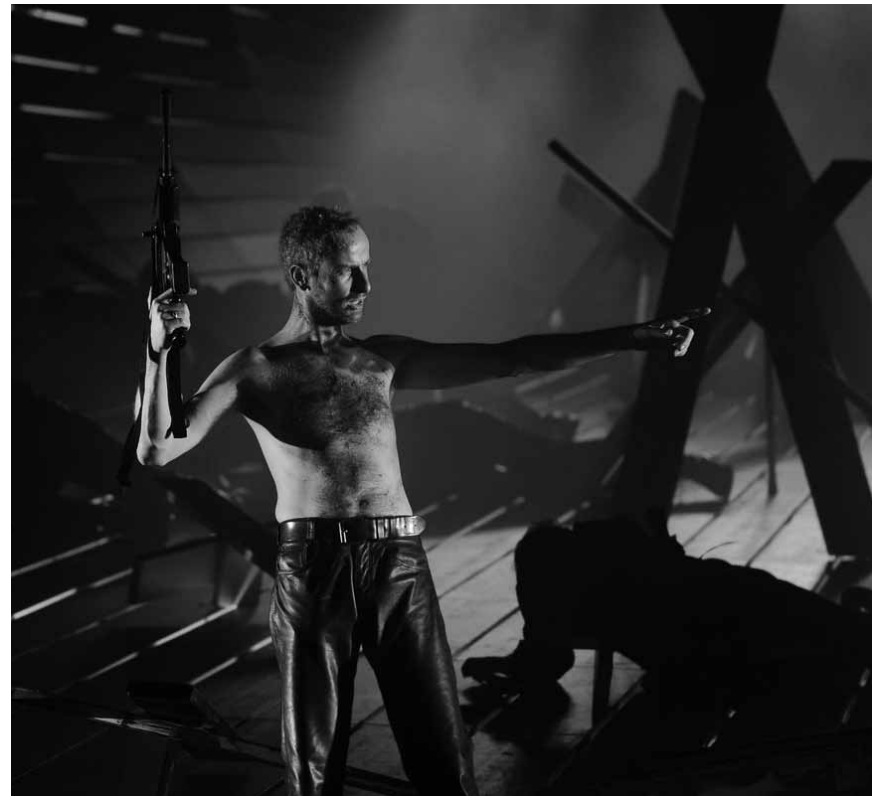
Immer schön gerade zielen und alles wird gut in der Alpenrepublik: „Guillaume Tell“, Oper von Gioachino Rossini an diesem Freitag, dem 24. November im Staatstheater Saarbrücken.