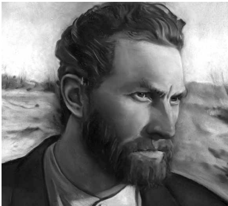
Une prouesse technique pour un résultat mitigé.

Pari colossal, le film est la preuve que parfois une idée originale ne suffit pas pour créer une œuvre consistante.