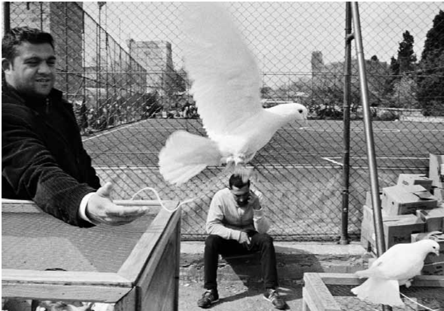
Colombes pacifiques qui apporte la paix et bien d'autres clichés d'Yvon Lambert vous attendent à Clervaux au jardin du Bra'Haus : « Histoires de frontières », jusqu'au 29 septembre prochain.