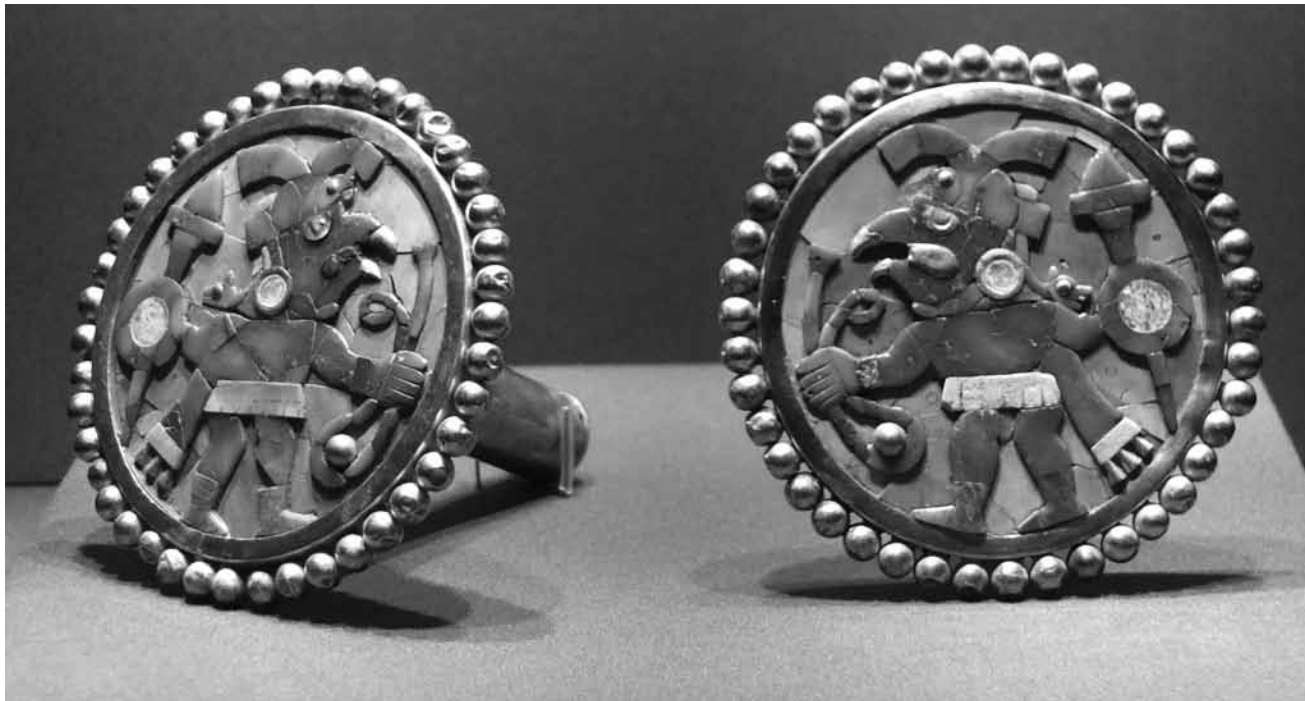
„Inka: Gold. Macht. Gott.“ geht in die Verlängerung: Die Ausstellung im Weltkulturerbe Völklinger Hütte dauert noch bis zum 8. April.

bis zum 13.1., Sa. + So. 14h - 17h sowie nach Vereinbarung.