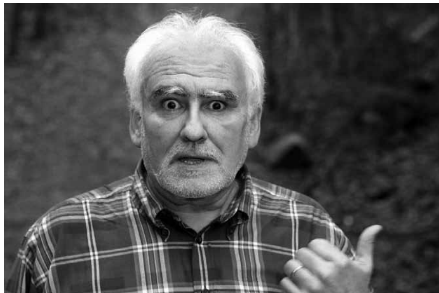
Wat hunn d'Lëtzebuurger iwwer „Lëtzebuurger Soen“ ze soen? Dat gëtt een den 4. Mäerz am Cube521 zu Maarnech gewuer.