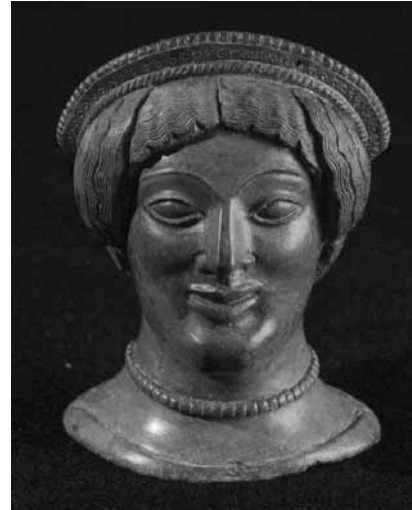
Une civilisation ancienne débarque au MNHA : « Le lieu céleste. Les Étrusques et leurs dieux » - à partir du 15 mars.

Visites guidées les me. 19h (GB), sa. 11h (L), 15h (D), 16h (F), di. 11h (GB), 15h (D), 16h (F).