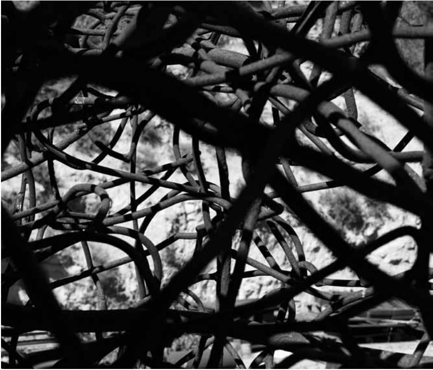
Les sculptures de Bernard Pagès sont à voir entre le 17 mars et le 19 mai chez Ceysson & Bénétière au Windhof.

Mitgliederausstellung 2018, Galerie im 1. Obergeschoss der Tufa (Wechselstr. 4).