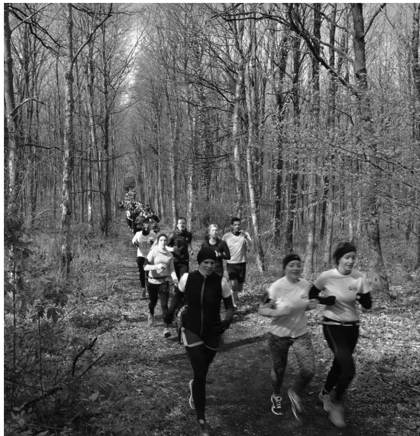
Wien nach net aus dem Wanerschlof erwächt ass, kann dat Sonnden, den 22. Abrëll beim „E Laf fir d'Natur“ nohuelen - den Départ ass op der Kockelschëier.