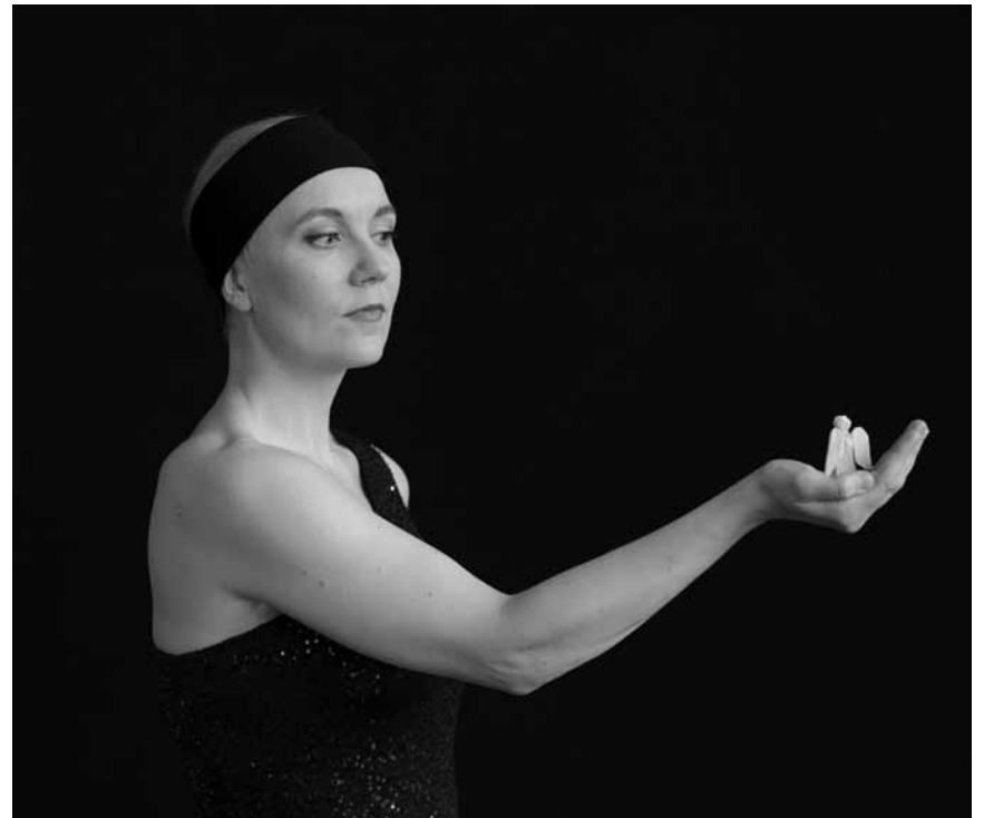
„Salomé“ – nach der Erzählung von Oscar Wilde in der Fassung von Richard Strauss, an diesem Samstag, dem 14. April im Saarländischen Staatstheater in Saarbrücken.