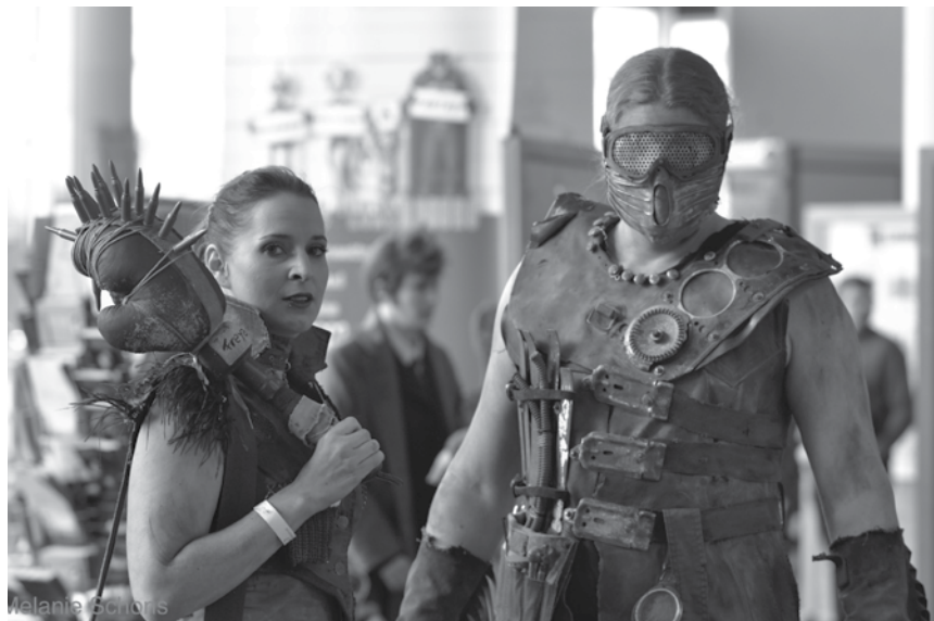
Wem der Politzirkus zu bunt wird, kann sich auf der Luxcon auch mit ganz normalen Menschen treffen - vom 13. bis zum 14. April im Forum Geeseknäppchen.

Salome , Musikdrama von Richard Strauss nach der gleichnamigen Novelle von Oscar Wilde, inszeniert von Jakob Peters-Messer, Saarländisches Staatstheater, Saarbrücken (D), 19h30. Tél. 0049 681 30 92-0. www.staatstheater.saarland