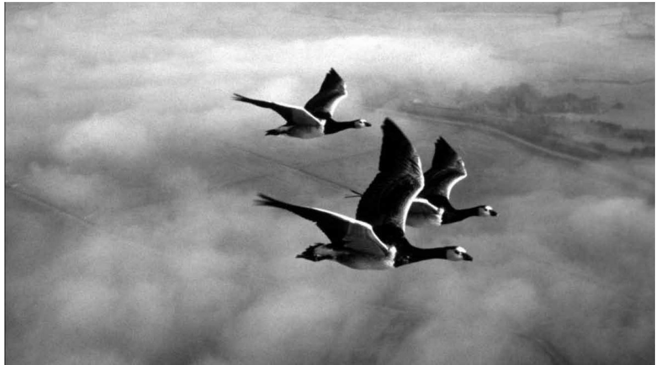
Libre comme les oiseaux : « Le peuple migrateur », documentaire de Jacques Perrin, sera le 13 mai à la Cinémathèque.

Boon, ein Hilfsarbeiter und Gelegenheitsgauner, „borgt“ sich das neue Automobil seines Arbeitgebers. Mit dem Auto macht Boon sich auf den Weg nach Memphis, begleitet von Ned, dem farbigen Stallburschen, und Lucius, einem altklugen Zwölfjährigen. Bei einem Pferderennen muss Lucius sein Pferd als Erstes durchs Ziel