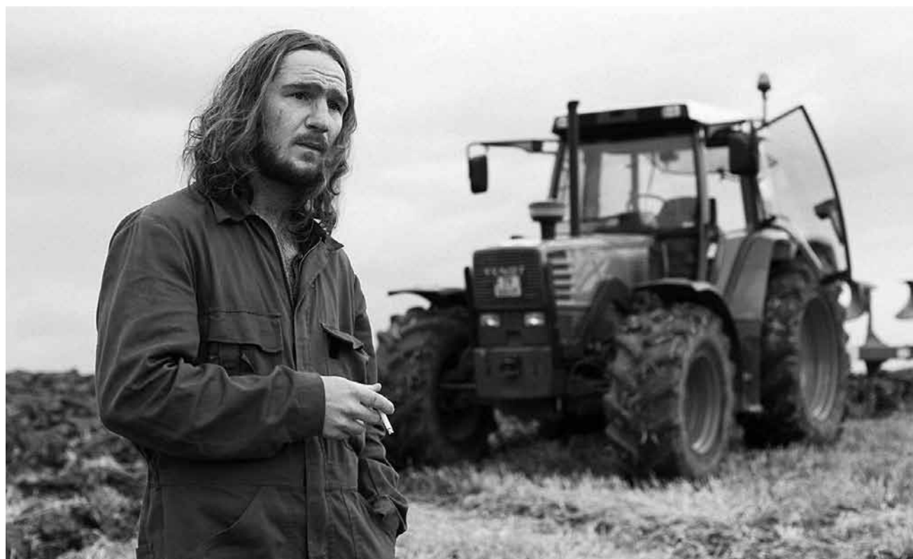
Dunkle Geheimnisse in einem luxemburgischen Dorf und ein Fremder der selbst nicht so unschuldig ist wie er sich gibt: „Gutland“ von Govinda Van Maele läuft diese Woche in fast allen Sälen an.

Das junge Delfinmädchen Echo erkundschafte das Korallenriff, in dem es mit seiner Familie lebt. Dieses muss sich auf all seine Anwohner verlassen können, um ein gutes Heim zu bleiben. Der weite Ozean bietet allerdings verlockende Abenteuer, die insbesondere verspielte Defne wie Echo verheißungsvoll ins weite Blau hinausziehen wollen.