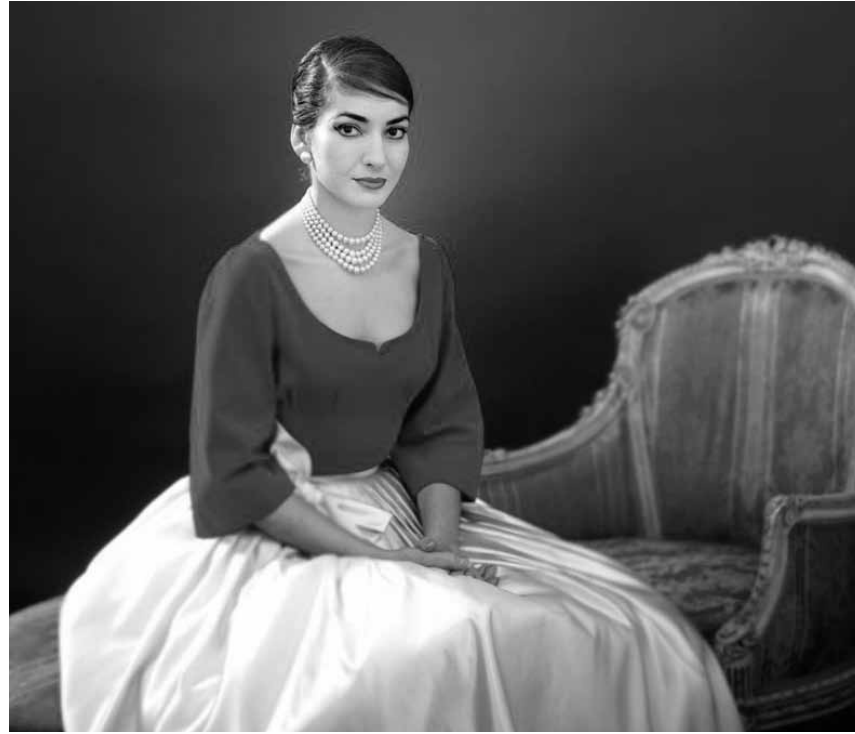
La Callas, une déesse vivante aux côtés obscurs : le documentaire « Maria by Callas » est nouveau à l'Utopia.

Rose et Alice sont deux sœurs très différentes. Rose est libre et rock'n'roll. Alice est rangée et responsable. Elles ne sont d'accord sur rien, à part sur l'urgence de remonter le moral de Françoise, leur mère, fraîchement larguée par leur père pour une femme beaucoup plus jeune. La mission qu'elles se sont donnée est simple : « sauver maman », et le cadre des opérations bien défini : un club de vacances sur l'île de la Réunion.