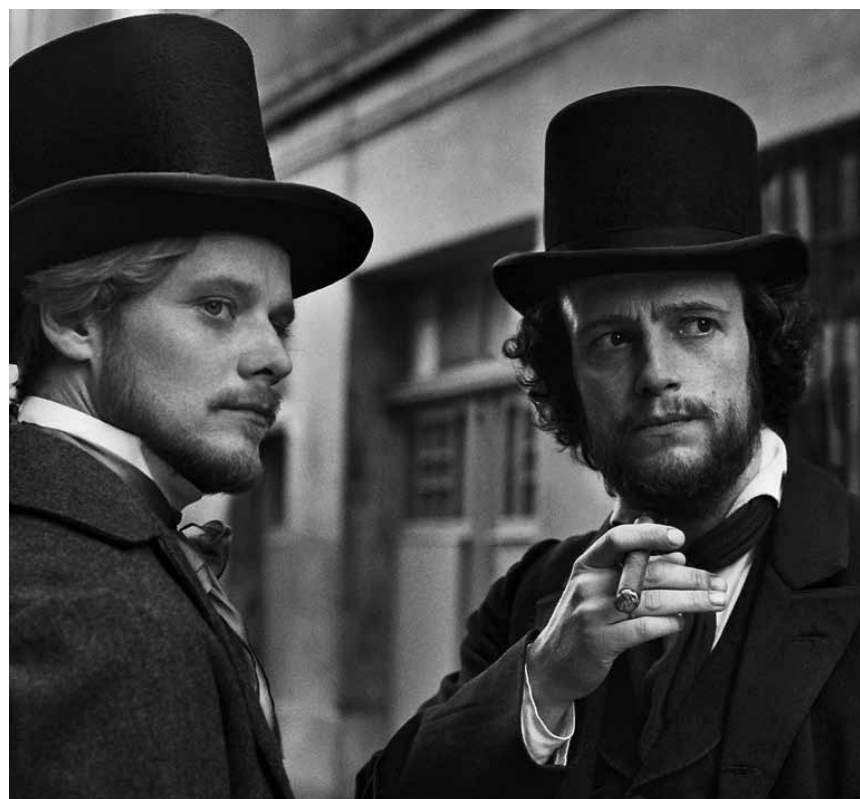
Alles Marx oder was? Der noch nicht so bärtige Philosoph steht im Zentrum von „Der junge Karl Marx“ - am 5. Mai im Utopia.

USA 1993 von Steven Spielberg. Mit Sam Neill, Laura Dern und Jeff Goldblum. 122'. O.-Ton + Ut. Ab 12.