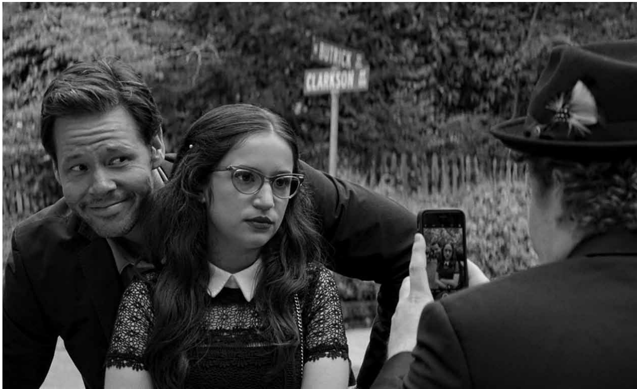
Wenn Eltern zu Kontrollfreaks werden: „Blockers“ neu im Kinepolis Belval und Kirchberg.