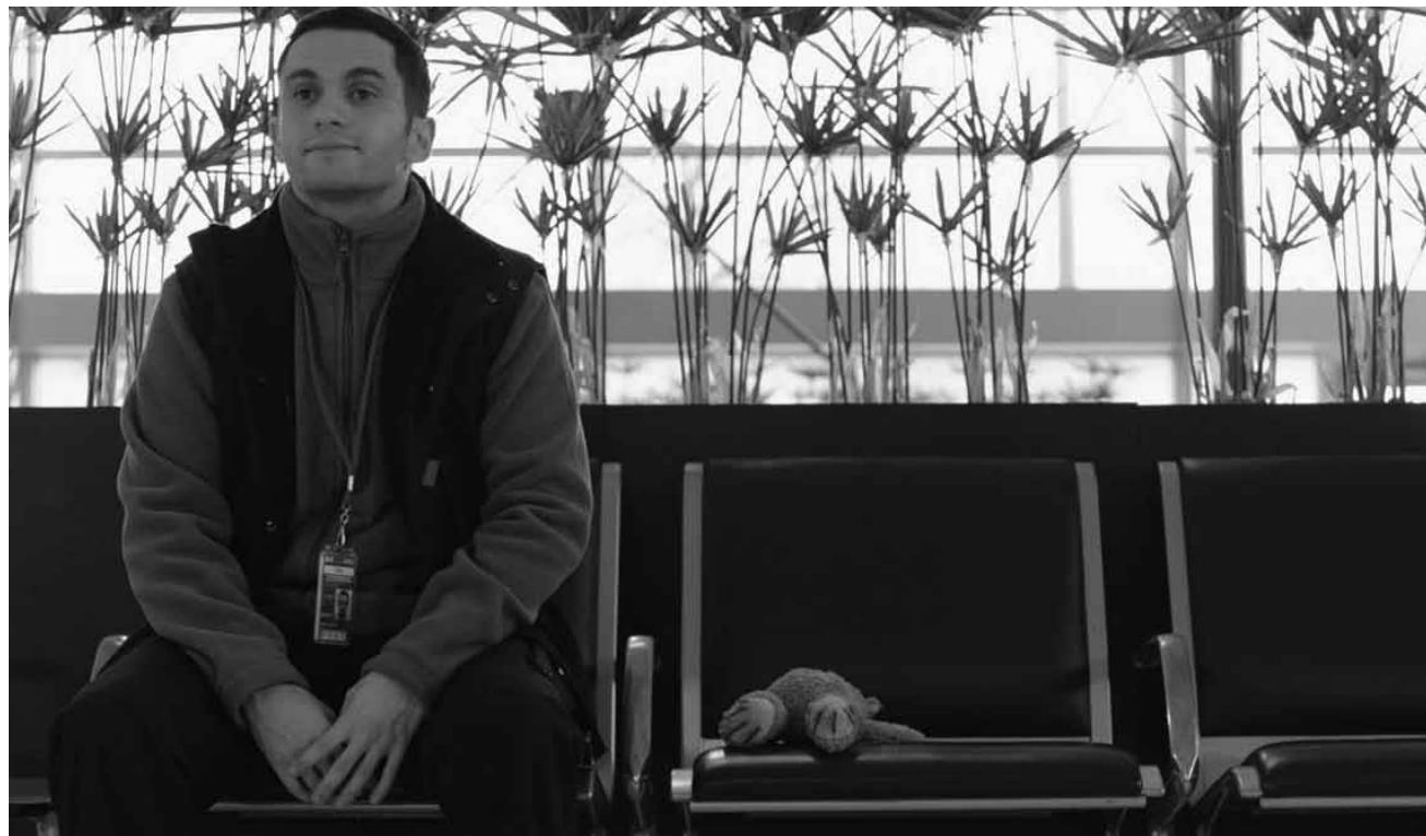
Quand la recherche d'un doudou mène à... encore une comédie française à la noix : « Le doudou », nouveau au Kinopolis Kirchberg.