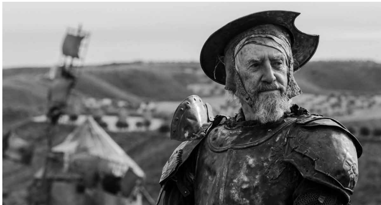
Ein im Jahr 2000 begonnenes Projekt sieht endlich das Licht der Projektoren: Terry Gilliams „The Man Who Killed Don Quixote“ ab dieser Woche neu im Utopia.

Nachdem ein Versuch fehlgeschlagen ist, ein gestohlenes Pandababy zu retten, muss der machohafte,