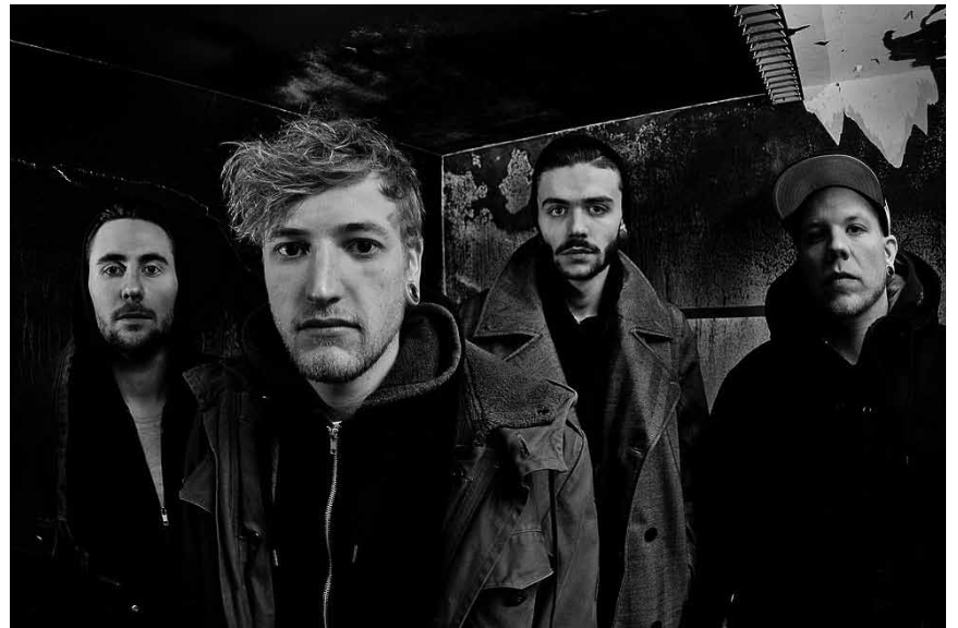
„Rogers“ aus Düsseldorf macht anständig lauten Punk mit deutschen Texten und kommt an diesem Freitag, dem 27. Juli ins Trierer Exhaus.