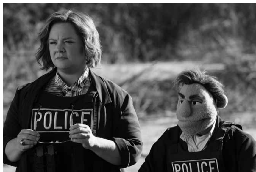
Sesamstraße mal wirklich nicht jugendfrei: In „The Happytime Murders“ morden und vögeln die beliebten Puppen, dass die Schwarte kracht – am 22. September im Kinopolis Belval.