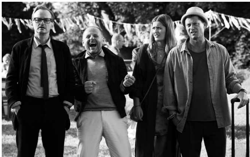
Til Schweigers neuester Versuch witzig zu sein beschäftigt sich mit dem Älterwerden: „Klassentreffen 1.0 - Die unglaubliche Reise der Silberrücken“ - neu in fast allen Sälen.

ist. Sich mit der falschen Seite zu verbünden, kostet schlimmstenfalls Leben. Das ist natürlich keine neue Erkenntnis. Es schadet allerdings auch nicht, immer wieder aufs Neue daran erinnert zu werden. (tj)