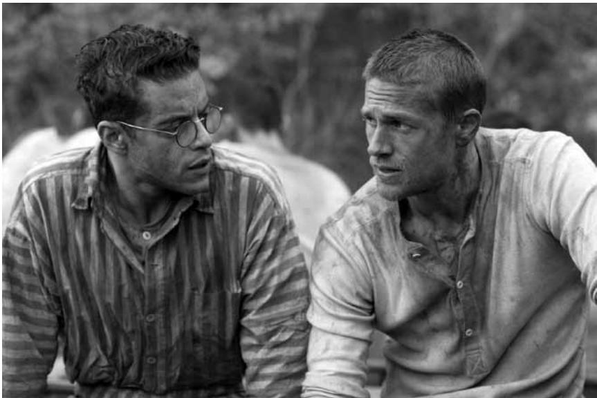
In „Papillon“ – eine Neuverfilmung des Werks von Franklin J. Schaffner aus dem Jahr 1973 – geht es um die „reale“ Geschichte von Henri Charrière der sich aus der französischen Strafkolonie in Guyana befreien konnte – neu im Kinopolis Kirchberg.

Une célèbre actrice iranienne reçoit la troublante vidéo d'une jeune fille implorant son aide pour échapper à sa famille conservatrice. Elle demande alors à son ami, le réalisateur Jafar Panahi, de l'aider à comprendre s'il s'agit d'une manipulation. Ensemble, ils prennent la route en direction du village de la jeune fille, dans les montagnes reculées du Nord-Ouest où les traditions ancestrales continuent de dicter la vie locale. XX « Trois visages » est un vrai plaisir à voir : une fable rebelle sur l'Iran méconnu, un voyage en terre inconnue et surtout le plaisir de voir Jafar Panahi continuer à mener sa carrière cinématographique malgré les interdictions et les menaces que le régime fait peser contre lui. (lc)